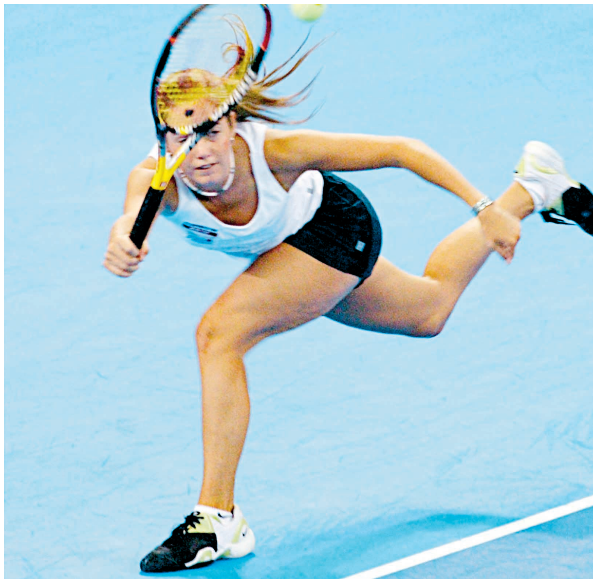
Débordée, la Tchèque Klara Koukalova s'est inclinée 2-6 et 2-6 devant Serena Williams, hier. La première raquette mondiale a ainsi assuré la qualification des États-Unis à la ronde quart de finale de la Coupe de la Fédération.

« Ça fait vraiment du bien de gagner en Espagne », a confié Moya à la fin du match rappelant qu'il n'avait jamais gagné sur ses terres malgré huit participations à Barcelone, une dizaine de participations à Majorque, son île natale, et quelques tentatives à Valence.