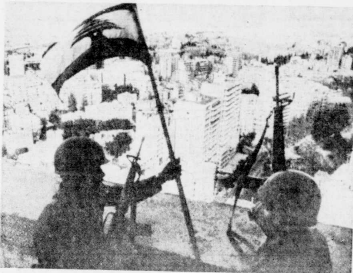
Geste de souveraineté