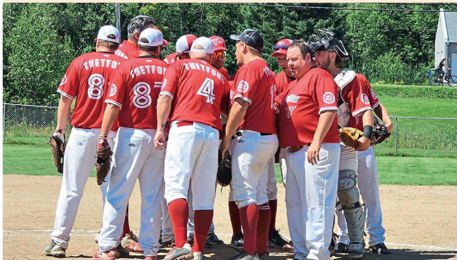
Le tournoi des champions avait lieu à Princeville lors de la fin de semaine de la fête du Travail.