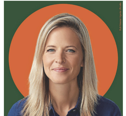
La candidate de Québec solidaire assure que la protection de l'environnement est l'une de ses priorités.

Le plan prévoit notamment une réduction d'au moins 55 % des émissions de gaz à effet de serre (GES) d'ici 2030. Gage du sérieux de la démarche de Québec solidaire, son plan climat a été vérifié par huit expert(e)s indépendant(e)s