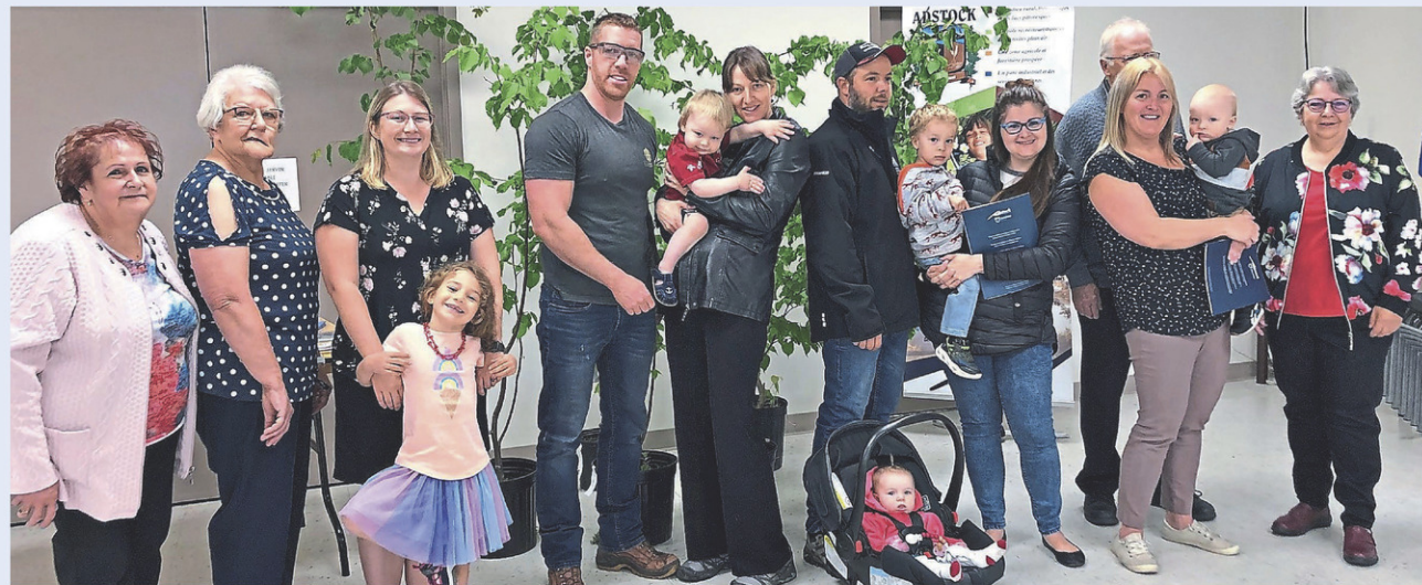
Les nouveau-nés en compagnie de leur famille, des organismes participant à cet événement et des élus de la Municipalité d'Adstock

Dix ans après la création de la première édition « Une naissance deux arbres », c'est plus d'une centaine d'arbres qui ont été distribués auprès d'enfants provenant d'Adstock. Pour la prochaine année et pour ceux qui ne l'avaient pas encore fait, il est déjà possible d'inscrire son nouveau-né en communiquant avec la municipalité au 418 422-2135, poste 221.