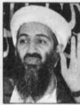
L'ennemi numéro un

Dans son message, ben Laden évoquerait également les attentats du 11 septembre aux Etats-Unis, dont il est le principal suspect. «Ces grands événements» ont, selon lui, réfuté le fatalisme arabe qui consiste à dire «mais que pouvons nous faire?» face à la puissance américaine.