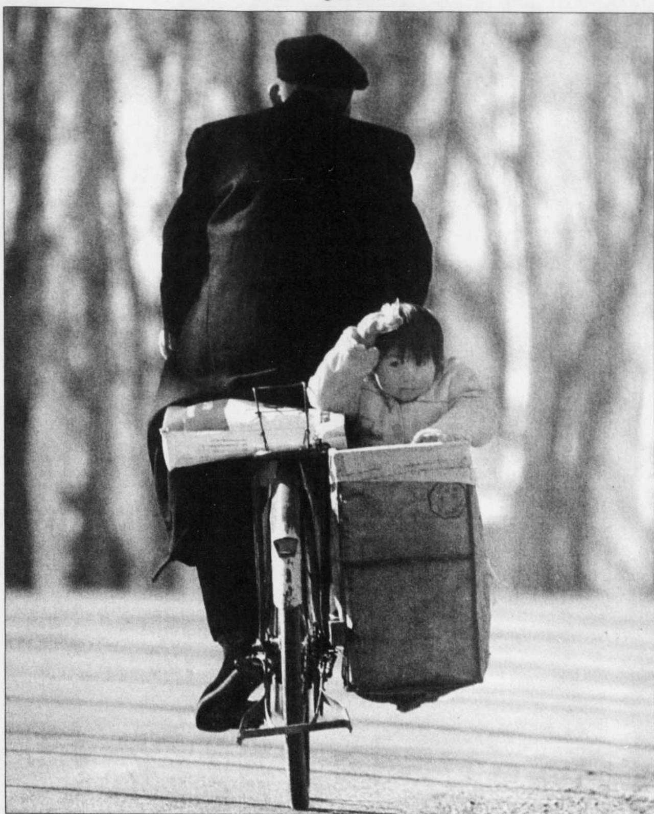
Ce n'est pas qu'un simple changement de noms ou de personnes qui aura lieu mais bel et bien un changement de cap pour ce pays de plus de 1,3 milliard d'habitants.