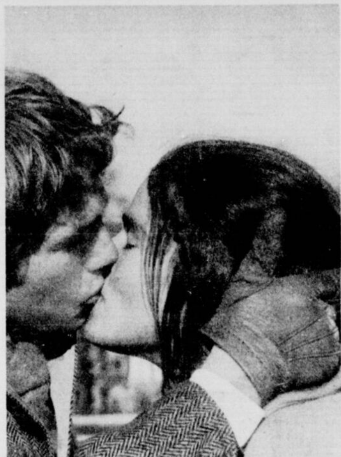
Erich Segal qui a surveillé personnellement la traduction française de son roman «Love Story» peut être fier. C'est aussi bon en français que dans la version originale anglaise. Le film «Love Story» est enfin montré en français au Champlain, et c'est sûrement le long métrage le plus intéressant des derniers mois, dans le genre.

SEVILLE "Loving" & "Laughing", 1 h.25, 3 h.25, 5 h.25, 7 h.25, 9 h.25. SNOWDON "Daddy darling" 1 h.20, 3 h.20, 5 h.20, 7 h.20, 9 h.20. VAN HORNE "Skin game" 1 h.20, 3 h.20, 5 h.20, 7 h.30, 9 h.25. VERDI (277-4145) — Dim. 31 oct. "La fiancée du pirate" 1 h.30, 9 h.30. VENDOME "La rupture" 12 h.45, 2 h.55, 5 h.10, 7 h.20, 9 h.30. VERDUN "Les fous volants" Sam. & Dim. 12 h.10, 4 h.05, 8 h.05 lun. à vend. 8 h.05. "Docteur ne coupez pas" Sam. & Dim. 2 h.30, 6 h.20, 10 h.20. lun. à vend. 6 h.20, 10 h.20. VERSAILLES (Salon rouge) "Vie amoureuse de l'homme invisible" Sam. Dim. Lun: 2 h.15, 5 h.10, 8 h.10, "Sexe monstre" 1 h., 3 h.55, 6 h.55, (Salon bleu) "Après-ski" et "Pile ou face" Sam. et dim. dès 1 h., sur sem. dès 6 h. VILLERAY (388-5577) — "Les fous volants" Sam. & Dim. 1 h.50, 5 h.50, 9 h.45. Lun. à vend. 5 h.50, 9 h. 45. "Docteur ne coupez pas" Sam. & Dim. 12 h. 10, 4 h.05, 8 h.05 Lun. à vend. 8 h.05. WESTMOUNT (486-7395) — "Carnal Knowledge", 1 h.15, 3 h.10, 5 h.15, 7 h.15, 9 h.20. WESTMOUNT SQUARE "T.R. Baskin" 1 h.25, 3 h.25, 5 h.25, 7 h.25, 9 h.30. YORK "Fortune in men's eyes" 1 h., 3 h., 5 h.05, 7 h.05, 9 h.15.