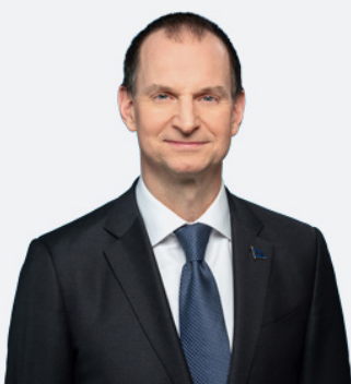
Eric Girard Ministre des Finances

Le budget 2022-2023 répond également aux défis qui attendent le Québec au cours des prochaines années en investissant dans les autres missions de l'État comme l'éducation, l'économie, l'environnement, la culture et le soutien aux collectivités.