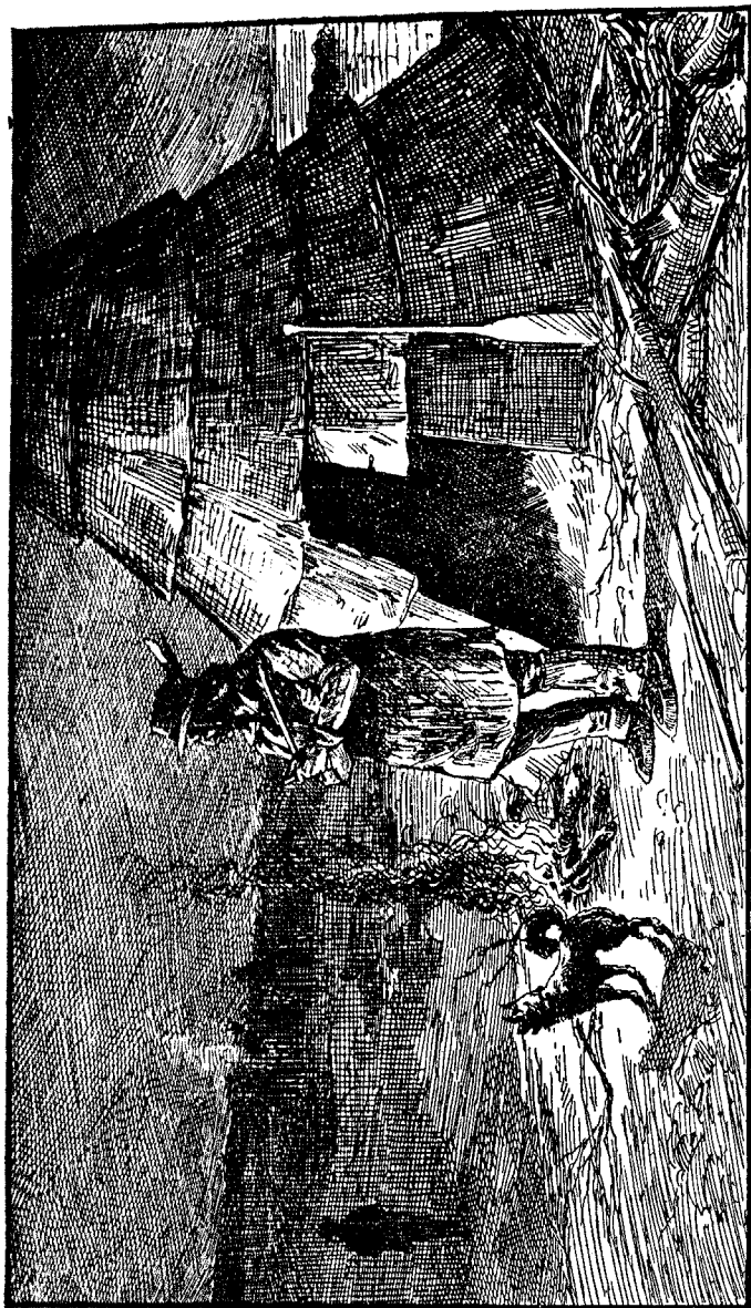
LA GRÈVE DU MANOIR DE SAINT-JEAN-PORT-JOLI.