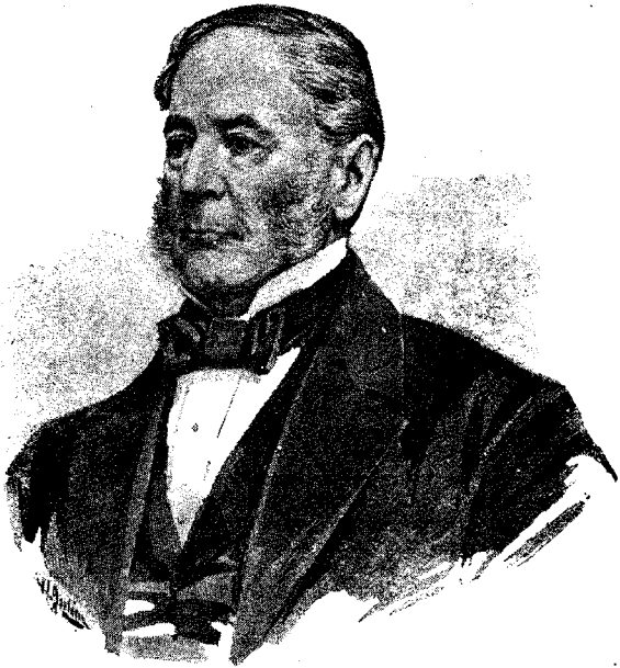
P. A. DE GASPÉ.