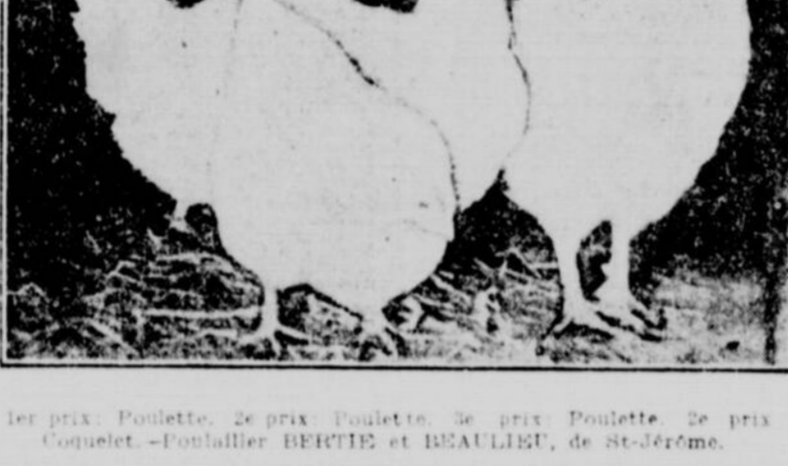
1er prix. Poulette, 2e prix. Poulette, 3e prix. Poulette, de prix Coquet, Poulailler BERTIE et BEAULIEU, de St-Jérôme.

du pays, MM. Bertie et Beaulieu ont obtenu le résultat suivant. 1er prix, coq; 1er et 2e prix, pour poules; 1er et 2e prix pour cochet, 1er, 2e et 3e prix pour poulettes; et au-delà de quinze prix spéciaux comprenant deux coupes d'argent.