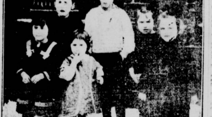
LES SIX ENFANTS dont le père et la mère sont morts, hier, dans des circonstances tragiques.

Le père et la mère de six jeunes enfants sont découverts baignés dans leur sang, hier matin. La mère était morte et le père mourut hier après-midi, après avoir parlé. Querelle de famille ou vengeance d'un tiers?