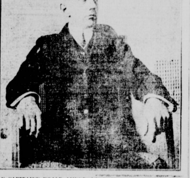
LE CAPITAINE ROALD AMUNDSEN, le découvreur du pôle Sud, qui est de passage à Montréal.

On a vu, depuis que la nouvelle de sa mort est arrivée au monde, l'énergie et la vigueur caractéristique du capitaine Scott. Son heureux rival est grand, mince, élégant, et tout dénote chez lui une grande énergie et un courage remarquable. C'est dans un des jolis petits salons du Fitz qui