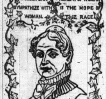
Portrait of a woman, likely related to the 'OH MATETE' advertisement.