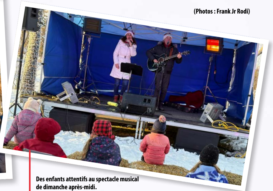
Des enfants attentifs au spectacle musical de dimanche après-midi.