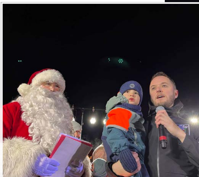
Le maire de Saint-Bruno était accompagné de son fils.

Enfin, le père Noël s'est confié au journal. « J'adore Saint-Bruno. Les gens y sont gentils et accueillants. J'adore cet événement, aussi. C'est rare, de nos jours, de voir un événement de la sorte, qui garde les traditions et redonne espoir. »