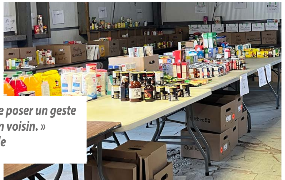
Les denrées sont préalablement triées avant d'être séparées selon les besoins.

Les surplus ou les produits particuliers reçus dans le cadre de la guignolée sont envoyés au CAB quelques jours après la distribution des paniers de Noël. L'organisme s'occupe du comptoir alimentaire. Les denrées recueillies