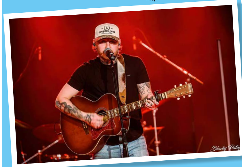
Gab Forest