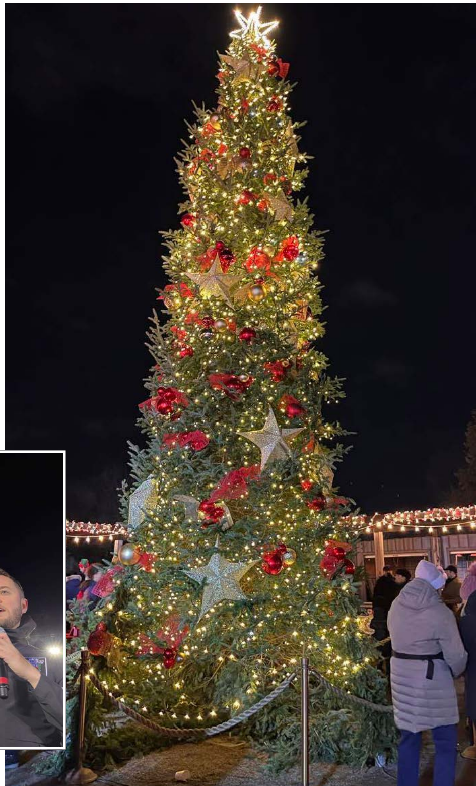
Le sapin illuminé.