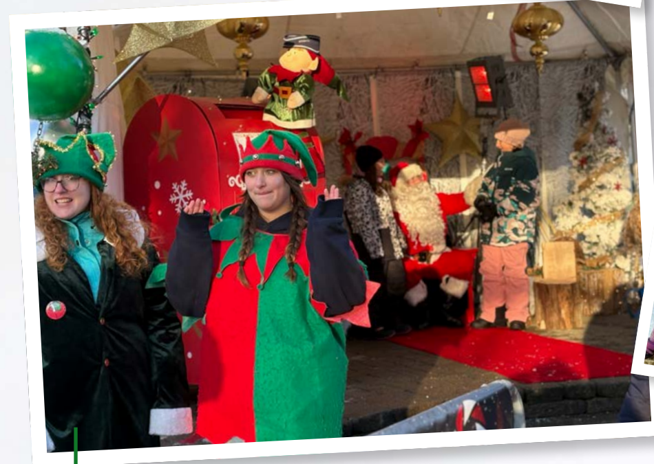
Le père Noël était présent en fin de semaine.