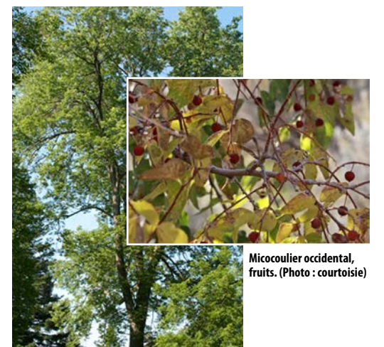
Micocoulier occidental.