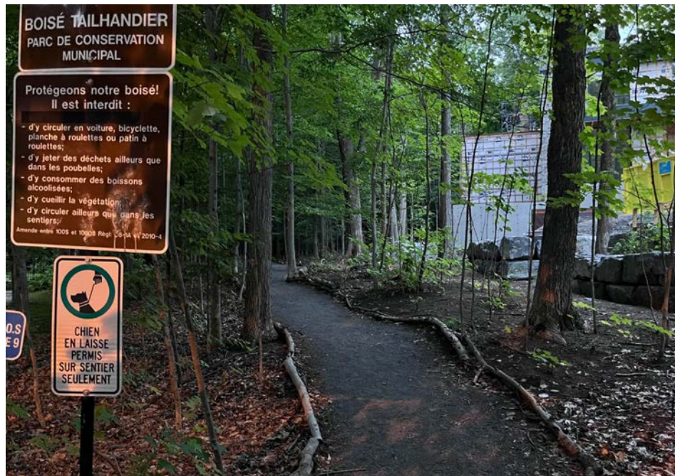
Des travaux de restauration écologique auront lieu au boisé Tailhandier à Saint-Bruno.

La Ville de Saint-Bruno-de-Montarville réalisera des travaux de restauration écologique sur un court sentier de 380 mètres dans la Réserve naturelle du Boisé-Tailhandier au cours de l'année 2025.