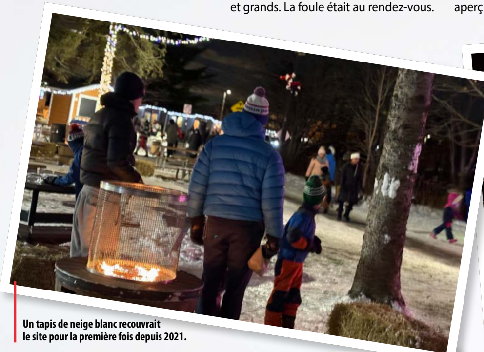
Un tapis de neige blanc recouvrait le site pour la première fois depuis 2021.