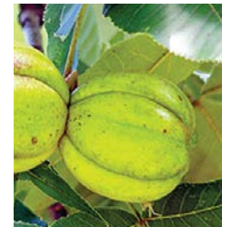
Caryer ovale, fruits.