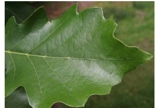
Chêne bicolor feuille.