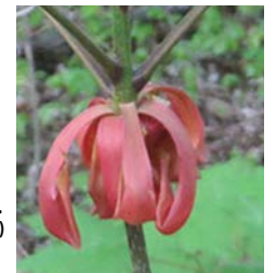
Caryer ovale, fleur.