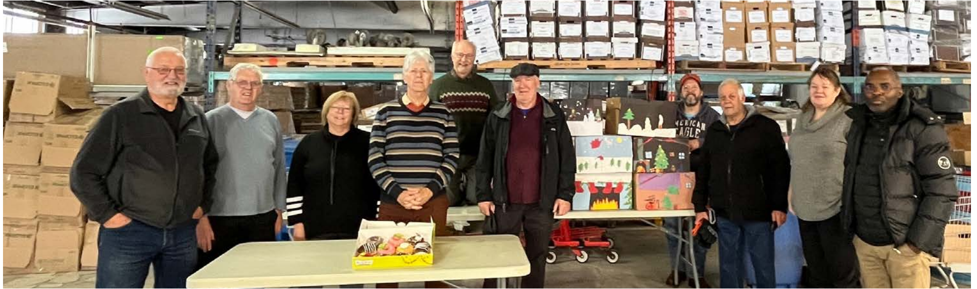
Une vingtaine de bénévoles travaillent à la préparation des paniers de Noël.

Tous les dons en denrées non périssables que les citoyens font à la guignolée de Saint-Bruno-de-Montarville finiront sur la table d'une personne dans le besoin, soit lors de la distribution des paniers de Noël ou par le biais de divers organismes au cours de l'année.