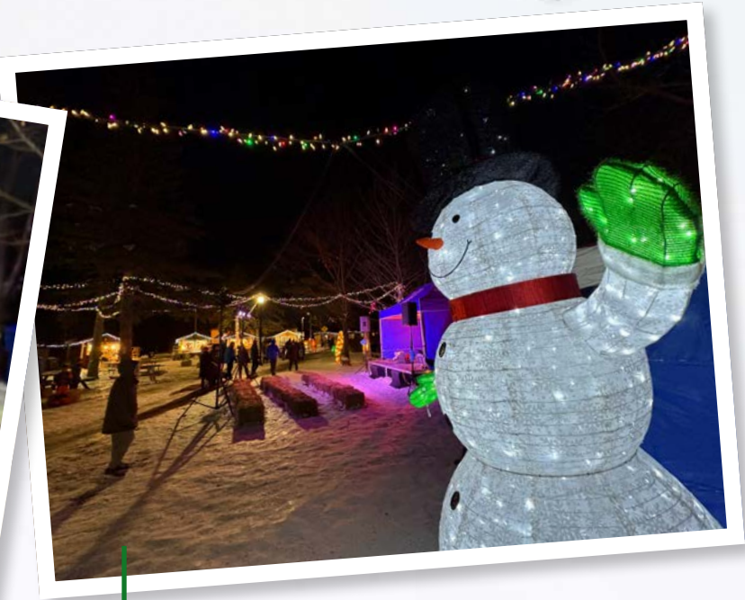
La Féerie lac du Village a eu lieu toute la fin de semaine à Saint-Bruno-de-Montarville.