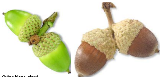
Chêne blanc, gland.