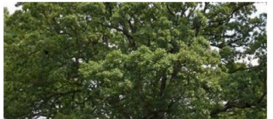
Chêne blanc.