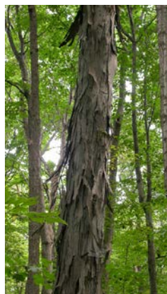
Caryer ovale.