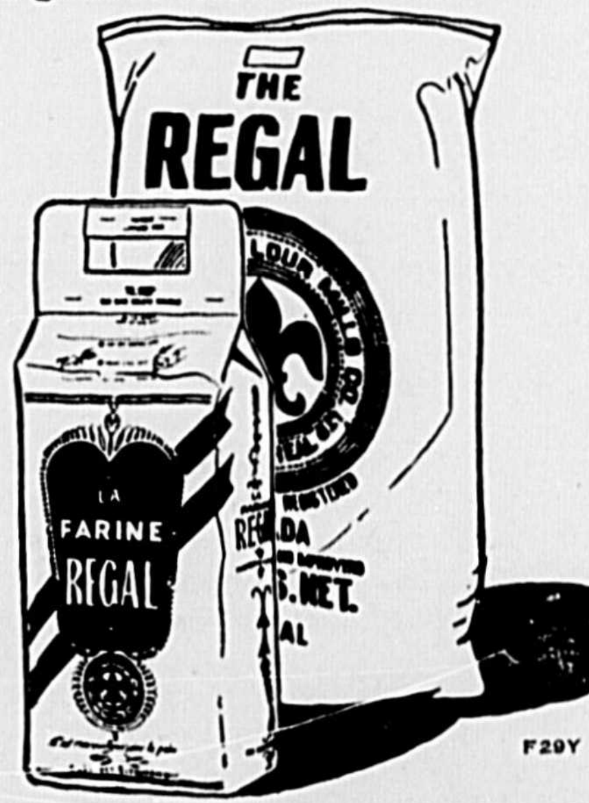
La Farine Regal se vend en sacs de 98, 49 et 24 livres et en sac pratique de 7 livres avec poignée

Faites dissoudre la levure dans une tasse de liquide tiède. Tamisez ensemble le sel, le sucre et la farine. Puis, mélangez les ingrédients secs avec tout le liquide, en battant bien pendant environ 20 minutes. Placez dans un endroit chaud (80 degrés) et laissez lever pendant environ 3 heures. Pétrissez 1 minute, puis laissez lever encore 2 heures. Donnez la forme de pain arrivant à la moitié de la hauteur des moules, et laissez la pâte lever jusqu'à ce qu'elle atteigne le haut des moules. Faites cuire de 50 à 60 minutes à four modéré.