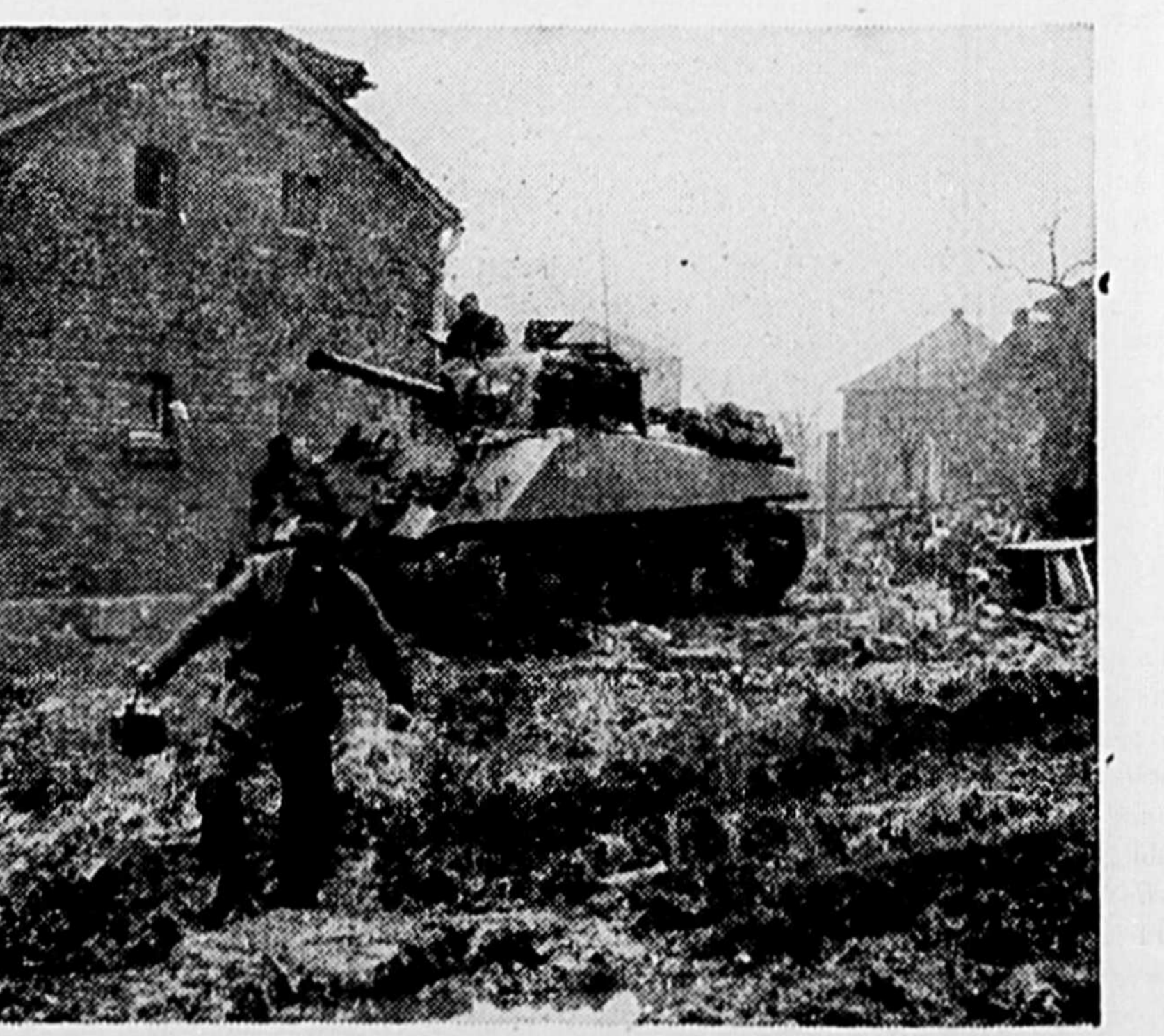
Des unités blindées britanniques poussent sur le Rhin et la Ruhr en compagnie de l'infanterie américaine, à l'est de Geilenkirchen. Ils constatent que la boue est aussi difficile à surmonter que l'ennemi. - La gravure représente: Un membre de l'équipage d'un tank britannique se frayant un chemin à travers la boue pour aller chercher de l'eau.