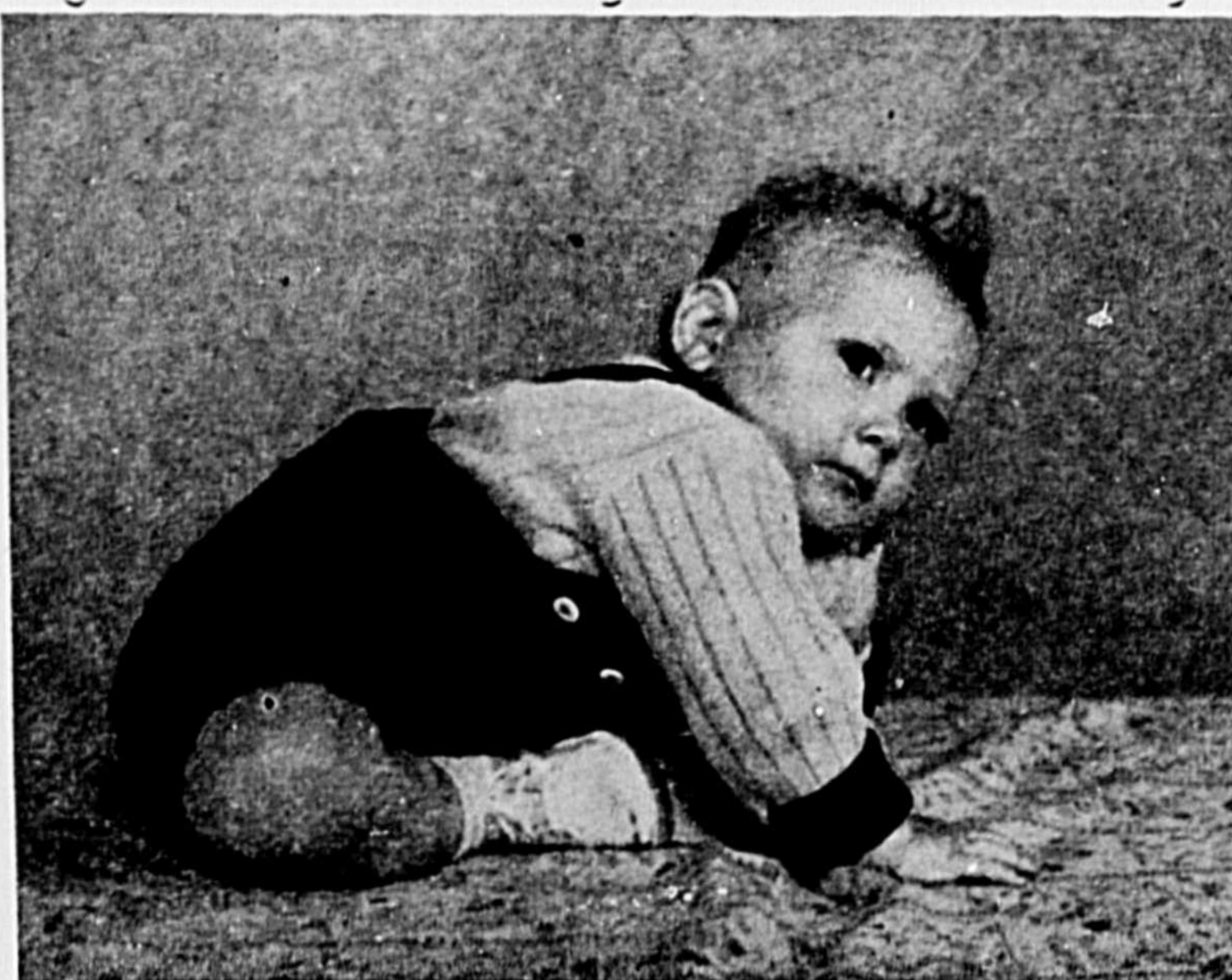
CET ENFANT A ETE ADOPTE ET IL FAIT LE BONHEUR DE SES HEUREUX PARENTS.

frappe aux portes des ménages sans enfants