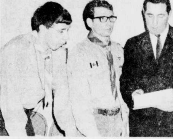
SEMAINE SCOUTE — La semaine internationale du scoutisme sera soulignée de brillante façon par la troupe scout de la paroisse St-Noël.

La centralisation persiste. "Même si trois gouvernements minoritaires successifs ont pris, depuis dix ans la di-