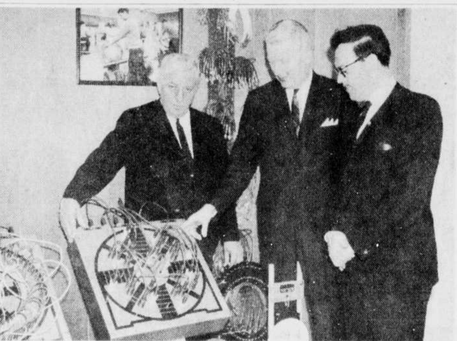
VISITE INDUSTRIELLE — Les membres du conseil municipal de la cité se sont rendus à l'usine Edwards, mercredi après-midi, pour effectuer une visite industrielle.