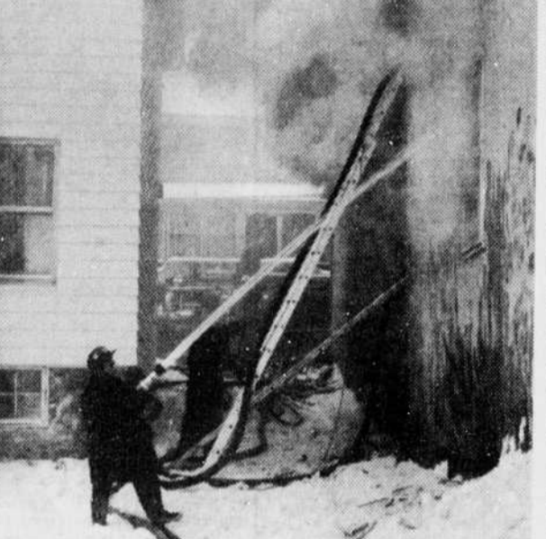
Pendant que le feu faisait rage et qu'une fumée dense s'échappait de la bâtisse incendiée, les sapeurs travaillaient ferme pour mettre terre à cet incendie qui, à un certain moment, a failli dégénérer en conflagration, dans le centre des affaires de Waterloo.

Le feu C'est à 8h. 20 hier matin que l'alarme a été sonnée au poste de police de Waterloo.