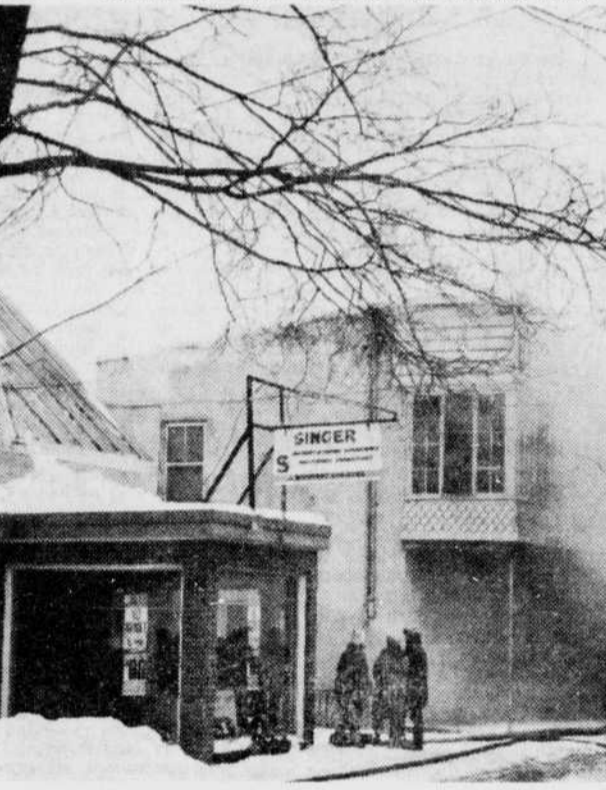
DOMMAGES DE $50,000 — Un violent incendie a ravagé un immeuble de deux étages, dans le centre des affaires de Waterloo, causant des pertes évaluées à $50,000. De nombreux curieux se sont massés sur les lieux, malgré la très froide température, pour surveiller le travail des sapeurs.

Conflagration évitée Grâce à leur travail, les pompiers de Waterloo ont toutefois réussi à éviter une conflagration. En effet, pas moins