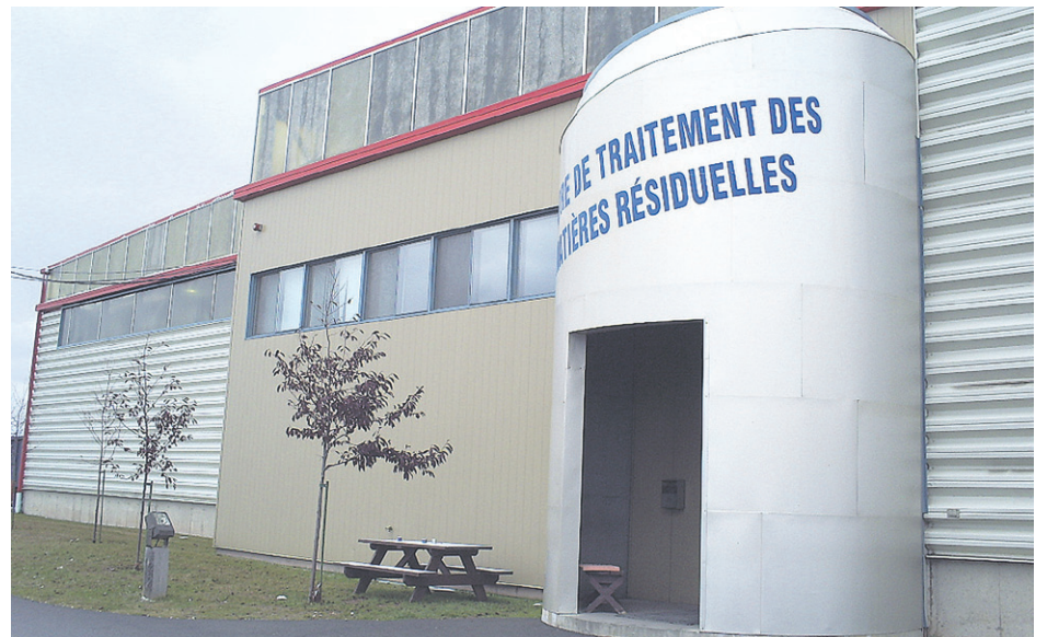
Le Centre de tri de Grande-Rivière