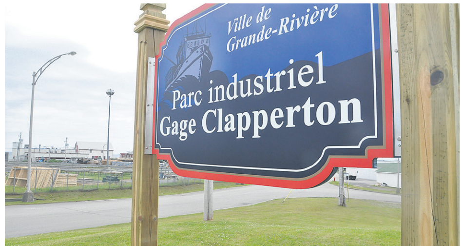
Gage Clapperton a été maire de 1964 à 1976.

« Si nous sommes réunis tous ici, c'est bien pour