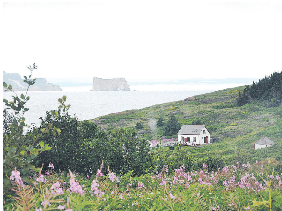
La Gaspésie pourrait aussi être frappée par une pénurie de main-d'oeuvre dans le domaine du tourisme.