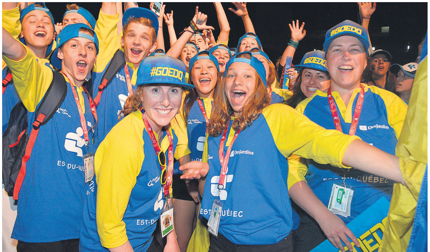
La délégation de l'Est-du-Québec lors de la cérémonie d'ouverture au stade olympique de Montréal.

Les Gaspésiens ont aussi eu la main heureuse en athlétisme, en faisant passer la région du 15 e au 7 e