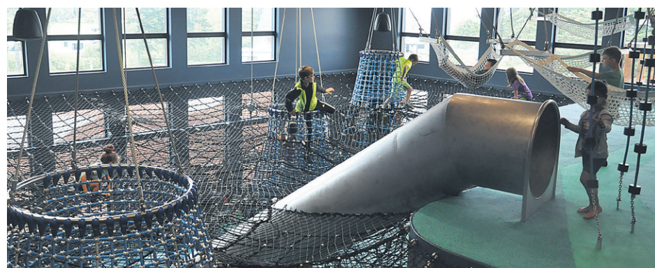
Ce vaste projet est une initiative de la Coopérative du Géoparc de Percé, évalué à 7,3 millions de dollars.

Les responsables pourront ensuite ouvrir les valves pour en faire la promotion à grande échelle en invitant touristes et vacanciers à venir (re)découvrir les joies de Percé, avec cette toute nouvelle institution qui viendra assurément prendre une place de choix dans l'offre de services déjà présente à Percé. (J.P.)