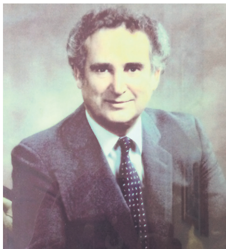
Le Parc industriel Gage-Clapperton a été inauguré samedi.

Si une telle effervescence est aujourd'hui toujours observable dans le parc industriel de Grande-Rivière,