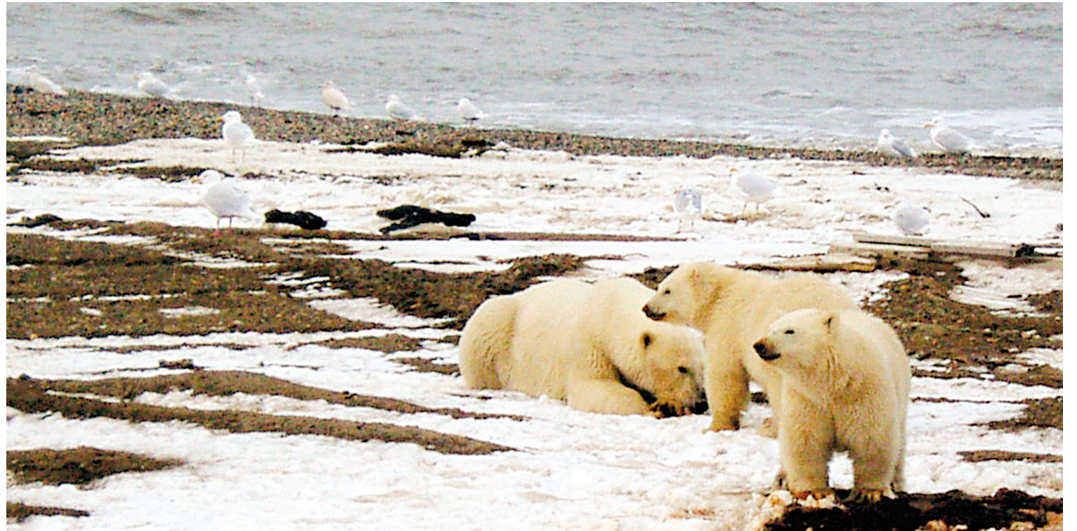
Une ourse blanche et ses deux rejetons sur les rives de la mer de Beaufort, en Alaska. La fonte des glaces oblige les ours à nager de plus en plus loin pour chasser et s'alimenter.

L'ours blanc fera peut-être prochainement son entrée, en tant qu'espèce préoccupante, sur la liste des animaux en péril du Canada. Et si c'est le cas, il pourra dorénavant être protégé