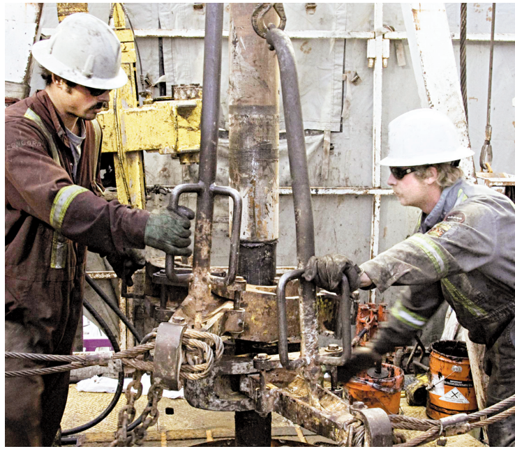
La juge a assimilé la démarche de Pétrolia à une volonté d'imposer le silence à ses détracteurs.

Mais la juge de la Cour supérieure ne s'est pas rendue aux arguments de l'entreprise. « Par la procédure, Pétrolia a voulu faire taire la coalition, bâillonner la liberté de presse et, en demandant une conclusion solidaire, on veut ainsi s'assurer de "contenir" aussi le journal Le Soleil ». Plus loin, elle souligne que « Pétrolia a utilisé de façon abusive le système judiciaire. Ce faisant, Pétrolia prive d'autres personnes du droit d'être