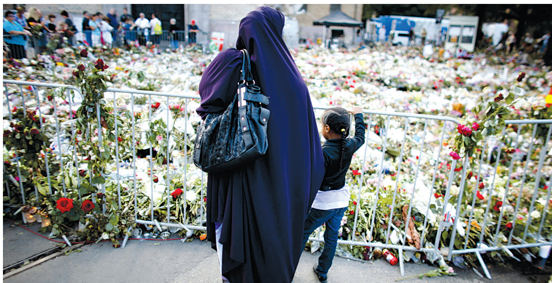
Une musulmane et son enfant sont venues offrir leurs respects hier à Oslo à la mémoire des victimes des attentats de vendredi dernier.