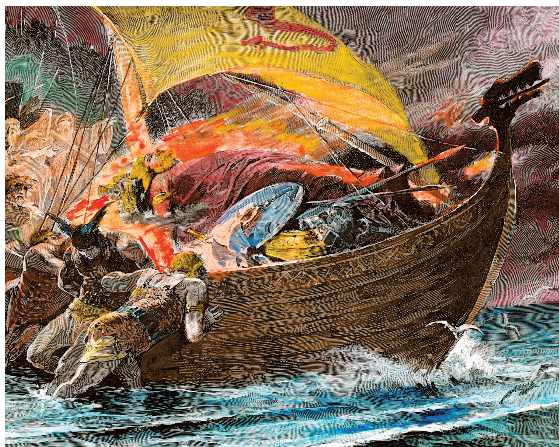
Le Viking, immortalisé ici par Alexander Zick, hante les débuts de la littérature scandinave.

Certains analystes ont parlé d'Anders Breivik comme d'un tueur « lone wolf », un loup solitaire à l'américaine, seul avec ses armes et ses convictions pour renverser un système auquel il ne