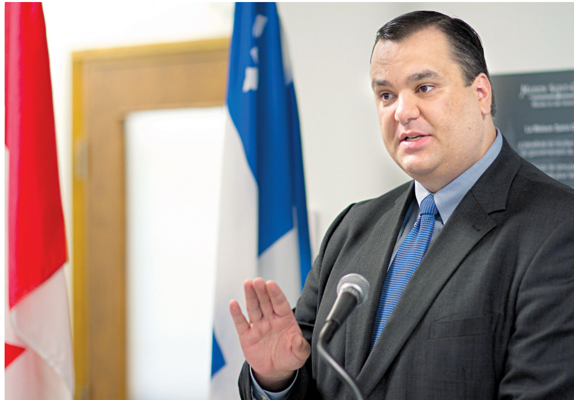
Le ministre James Moore a rencontré les médias hier au musée de la Maison Saint-Gabriel.

Le 20 avril dernier toutefois, la Conférence canadienne des arts donnait déjà, sans le savoir, une idée des sommes concernées dans son bulletin: «Radio-Canada [...] a été soumise à l'exercice de revue stratégique en préparation du budget fédéral 2010-2011: on lui demandait