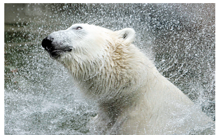
L'ours blanc pourrait bientôt faire son entrée sur la liste des animaux en péril du Canada.

AU QUÉBEC, NOUS AVONS D'EXCELLENTS RESTAURANTS ET LES MEILLEURS RESTAURATEURS. À COMPTER DU 1 ER NOVEMBRE 2011, ILS DEVRONT VOUS REMETTRE CETTE FACTURE UNIVERSELLE.