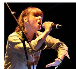
Cat Power