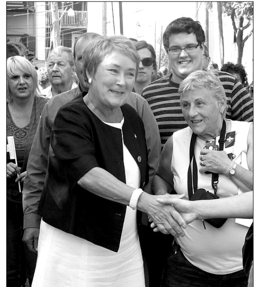
La Première Ministre du Québec : Pauline Marois