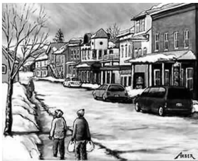
Les rues de Baie-Saint -Paul

Non loin de cette fabuleuse région, il y a d'autre ville à ne pas manquer. Tout d'abord, Tadoussac avec ses merveilleuses croisières qui vous permettent d'admirer des baleines, des bélugas, des marsouins, de nombreuses espèces de rorquals et de phoques. À seulement 15 minutes du Centre-ville de Québec, se trouve l'Île d'Orléans. Cette partie de la région remplie d'histoire vous fera revivre à l'aide de ses montagnes verdoyantes et de ses somptueux paysages, les coutumes d'antan.