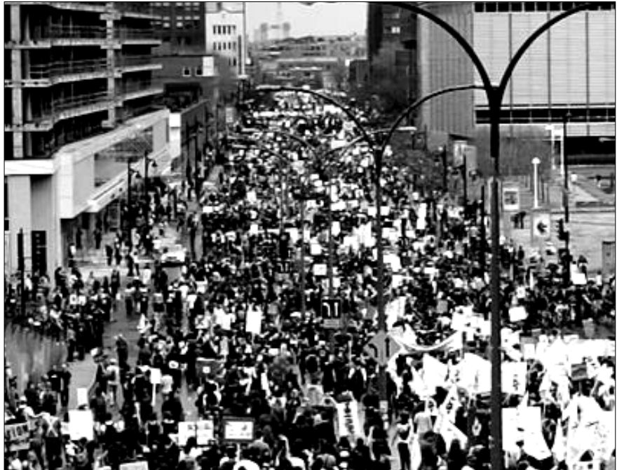
Manifestation du 22 mars 2012, Montréal

Mais lorsqu'on prend le temps de s'arrêter quelques instants pour y penser réellement, on réalise vite que ce phénomène d'oubli collectif est inquiétant, voire révoltant. Cette grève a touché directement chaque étudiant de notre Cégep. Tous ont dû choisir leur position par rapport à la grève. La plupart se sont renseigné sur la question, ont assisté aux assemblées générales. Plusieurs élèves particulièrement convaincus ont piqueté tous les matins, ont manifesté leur mécontentement, ont tenté de se faire entendre par le gouvernement. Certains ont donc décidé de militer, d'autres considéraient cet effort futile. Certains ont voté en faveur de la grève, d'autres contre, et certains autres ont pris la décision de ne pas voter du tout. Mais une chose est sûre : tous ont pris position. Car oui, même les indécis ou les désintéressés qui ne se sentaient pas en devoir de se prononcer sur la question ont fait le choix de ne rien faire. Se retrouver avec un tel pouvoir décisionnel sur l'avenir de notre société entre les mains nous a inévitablement responsabilisés, d'autant plus que c'était, pour une