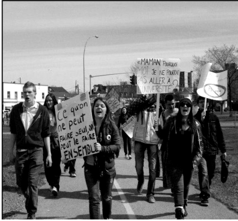
Manifestation du 3 avril 2012 à Gatineau

Nous avons pris position par rapport à la grève, il est maintenant temps de décider de quelle façon nous voulons évoluer comme population. Oublier n'est pas une option. À la suite du référendum de mai 1980 sur la souveraineté, Denys Arcand a réalisé « Le confort et l'indifférence », un documentaire visant justement à mettre en