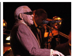
Ray Charles