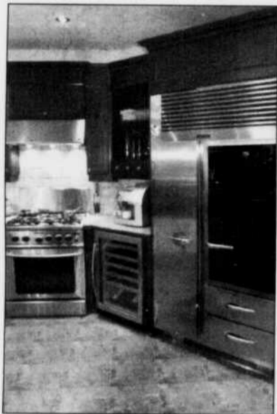
INOX - Le règne de l'inox dans la cuisine est loin d'être en perte de vitesse.