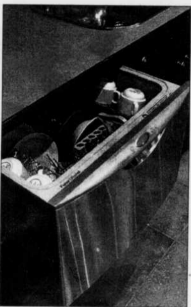
TECHNOLOGIE- Dans ce tiroir se cache un lave-vaisselle.

inox, la pièce est très belle, sans avoir l'air aseptisé. Pour ajouter au coup d'œil, des entreprises offrent aussi des îlots dont la surface est en inox, évidemment.