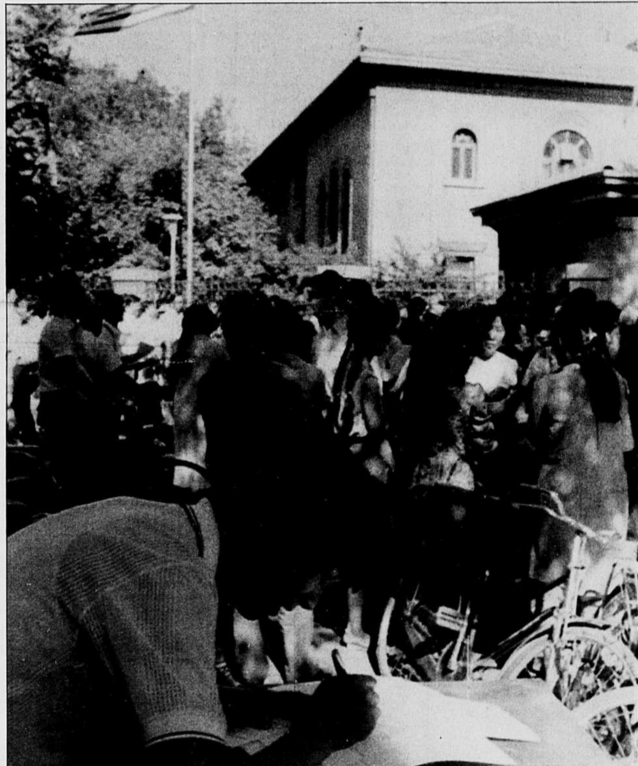
Alors que la répression s'accroît en Chine, des centaines de citoyens faisaient la queue hier devant l'ambassade américaine à Pékin pour remplir des demandes de visas.