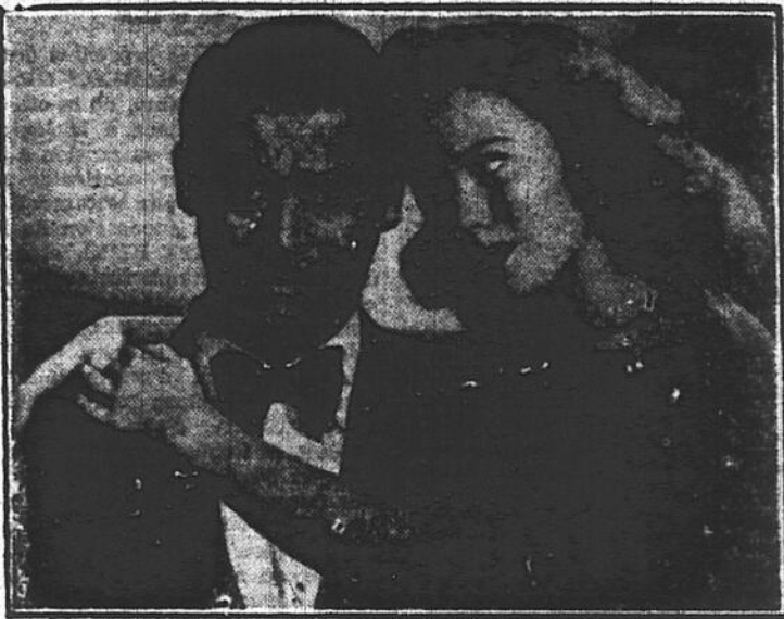
Cary Grant, vedette masculine et sa partenaire, la délicate et jeune Shirley Temple, dans une scène du film "The Bachelor and the Bobby-Soxer" présentement à l'affiche au cinéma Loew's.