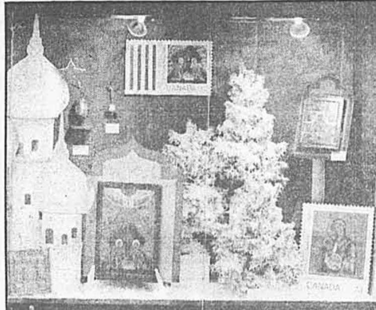
Partie de la vitrine représentant des icônes à la Maison de la Poste.

L'exposition des icônes durera jusqu'à la fin de janvier 1989.