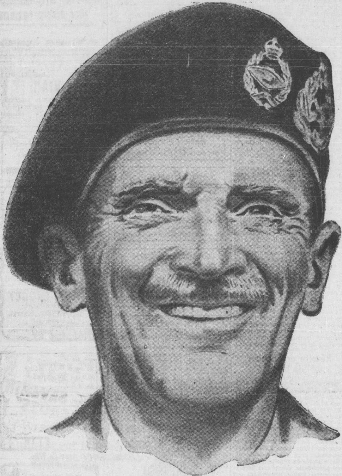
LE MARECHAL SIR BERNARD LAW MONTGOMERY, C.B., D.S.O.