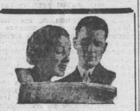
Le major-général Georges-P. Vanier, ambassadeur canadien en France, a récemment visité un cimetière canadien à Dieppe. On le voit ci-haut, entouré d'un groupe d'officiers de l'armée et de personnalités civiles.

lement ses vœux personnels, mais aussi les vœux de tous vos amis du Canada".