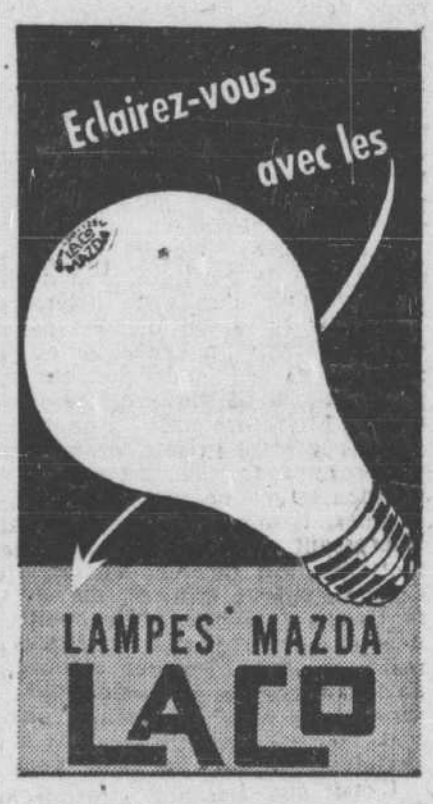
LAMPES MAZDA LACO

Londres, 13 (C.P.). — La radio de Berlin a radiodiffusé une dépêche de Tokio, aujourd'hui, disant que les avions japonais ont effectué un sérieux bombardement des aéroports alliés sur l'île Noemfoor, au nord-ouest de la Nouvelle-Guinée.