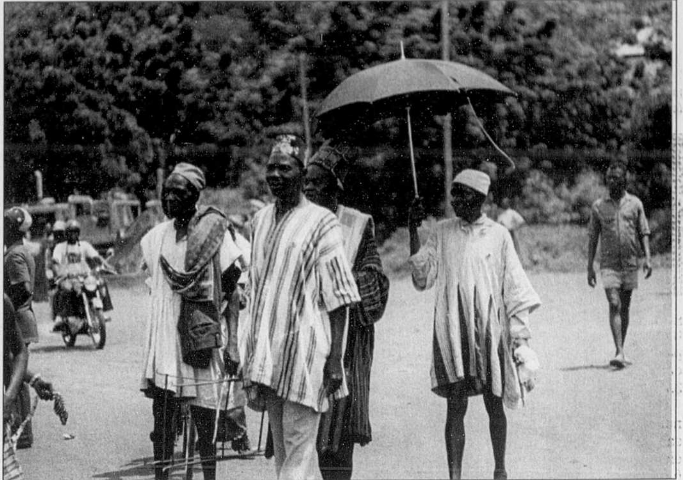
Les Konkombas, qui vivent au Nord-Togo, sont des agriculteurs animistes.

Mais le dictateur au pouvoir depuis 27 ans s'en prend aussi à sa propre députation. Le Monde du 16 février cite le Comité d'action pour le