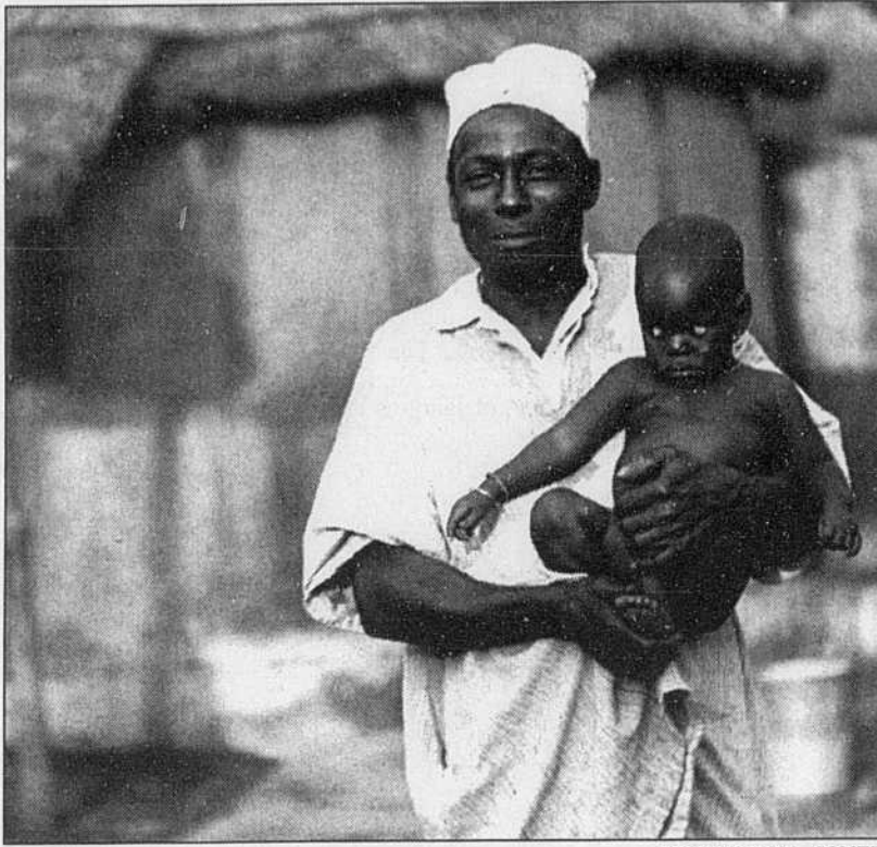
Un homme et son fils du pays konkomba.

Si rien n'est fait pour ramener le «miraculeux de Sarakawa» — (Eyadéma s'est tiré indemne d'un atterrissement forcé; un mausolée s'y trouve maintenant) — à la raison, nous risquons de voir apparaître un nouveau Libéria. Si le régime Mulrony a fermé les yeux durant les dernières années, le premier ministre Jean Chrétien et le ministre des Affaires étrangères André Ouellet ne peuvent rester indifférents devant le sort réservé à la population de ce pays de la Francophonie. Le Canada se doit d'intervenir par tous les moyens diplomatiques, bilatéraux et multilatéraux possibles.