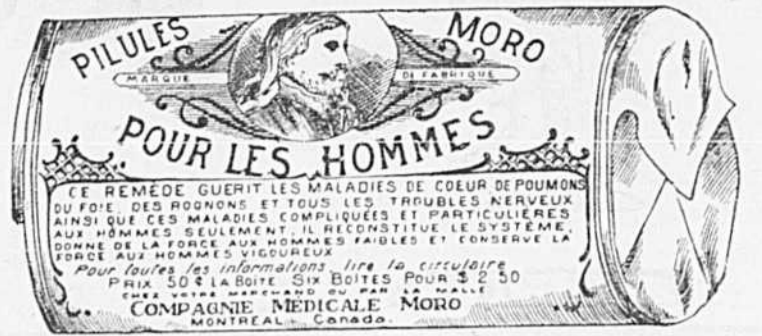
Fac-simile exact d'une boîte de Pilules Moro.

Donnez-nous un homme brisé par les excès, la dissipation, un travail trop dur, les tracas, ou par toute autre cause qui ait sapé sa vitalité, avec les Pilules Moro nous le rendrons aussi vigoureux en tous points, que n'importe quel homme de son âge.