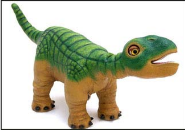
Le robot Pleo