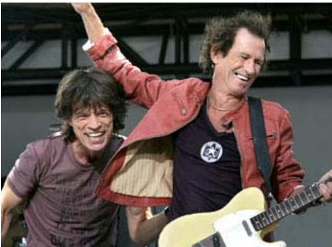
Mick Jagger et