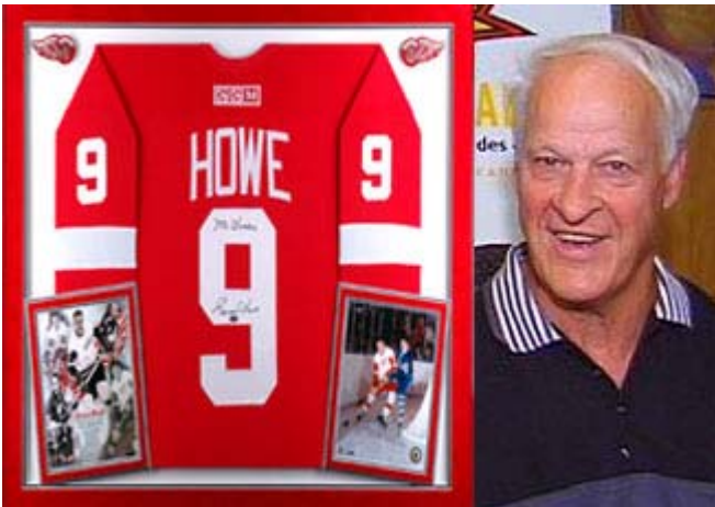
La légende du hockey Gordie Howe

Le pire voisin est celui que vous pensez être votre ami mais qui va porter plainte contre vous au Palais de Justice.