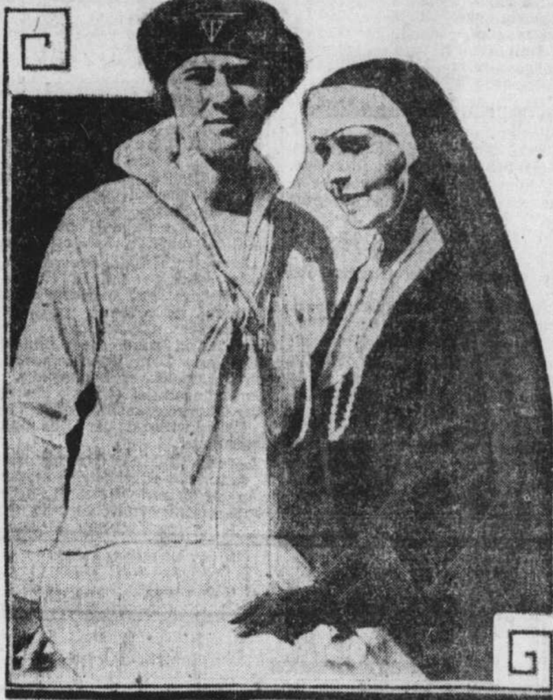
On voit ici la reine Marie de Roumanie et sa fille, la princesse Ileana, qui vient de rompre ses fiançailles avec le Comte Alexandre de Hochberg. Cette photographie a été prise dans les jardins du Robert College, le collège américain de Constantinople, alors que la reine et la princesse étaient en route pour l'Egypte.