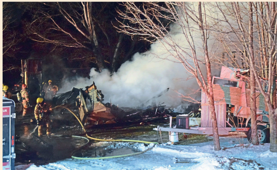
Plusieurs pompiers des brigades de Saint-Anselme, Sainte-Claire et Saint-Henri sont intervenus.

Une sortie de route, possiblement en raison de la chaussée glissante, est survenue peu