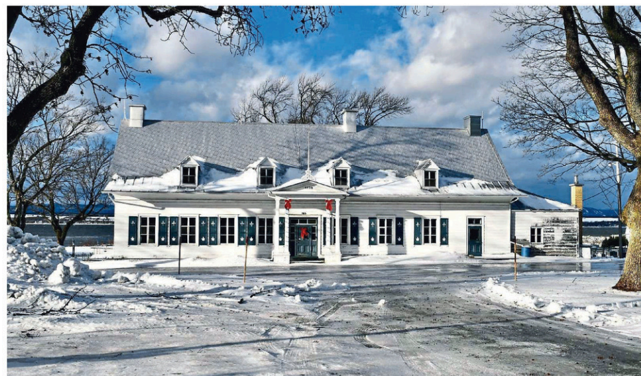
Le presbytère de Saint-Michel, ainsi que l'ensemble du site au cœur du village, sera officiellement classé patrimonial par le gouvernement du Québec.

Ce comité sera composé d'élus et de citoyens qui souhaitent s'impliquer, afin de préparer des consultations publiques sur différents actifs municipaux, dont le presbytère. « On va faire un premier tri, afin de s'attaquer aux projets chauds qui nécessiteront une consultation publique. Le comité entendra les projets et les suggestions, puis planifiera les consultations publiques avec les citoyens », mentionne-t-il en ajoutant que le comité devra donner les lignes directrices permettant de trouver la bonne vocation intérieure pour le presbytère.