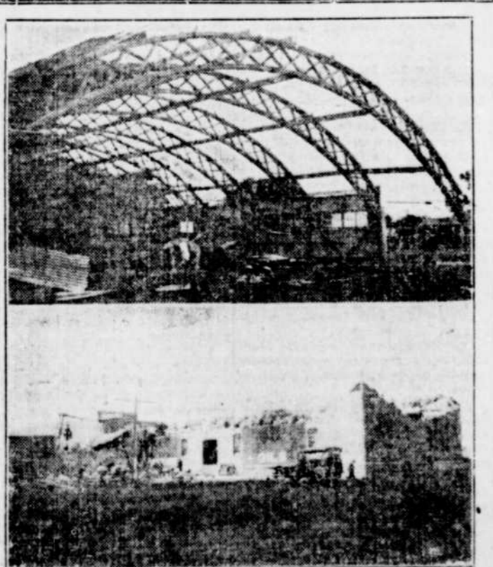
Coup d'oeil à Winnipeg où de gros dommages ont été causés par le dernier cyclone. En haut, la patinoire THISTLE dont le toit a été démolit; en bas, une solide bâtisse en briques qui a été réduite en débris.