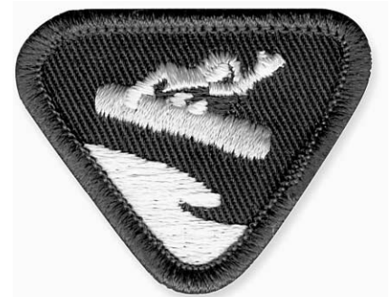
Même le surt des neiges apparaît maintenant sur les traditionnels écussons.

Et comme l'uniforme scout, inspiré de celui porté au début du siècle par le fondateur du mouvement, lord Baden-Powell, n'est pas