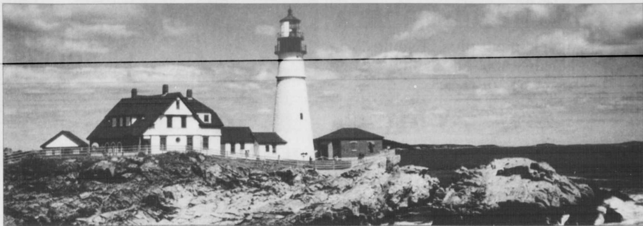
La route 1 qui longe la côte américaine est pratiquement celle des phares du Maine. L'idéal est d'entreprendre une tournée des phares dans Penobscot Bay, juste au nord de Camden.