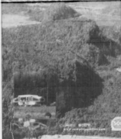
ARCHIVES, LE SOLEIL