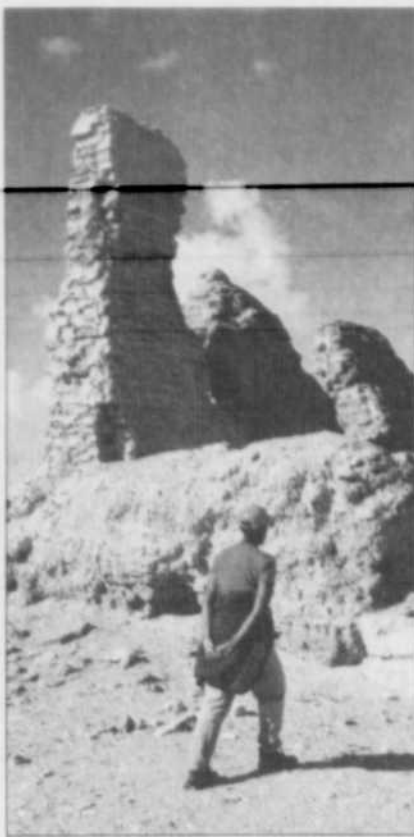
Le désert, vu de l'Égypte.