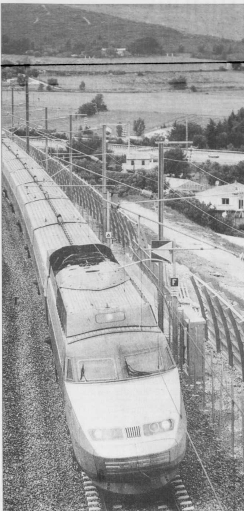
Depuis l'automne 2000, tout ou presque a été testé: vitesse, sécurité, impact des vents latéraux.

Elle compte aussi sur cette nouvelle ligne pour développer le trafic avec des destinations plus lointaines tels que le nord de la France. Elle annonce ainsi un Lille-Marseille en 4 heures 40, en passant par la gare TGV de l'aéroport parisien de Roissy.