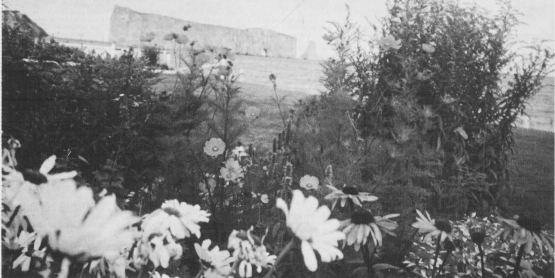
Le rocher Percé à travers les fleurs du jardin de l'hôtel Normandie.

Les maisons fleuries, principale attraction de la région