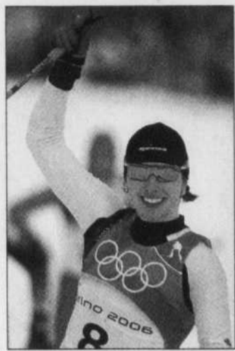
Le geste de la victoire de Chandra Crawford à l'arrivée du sprint féminin, hier.