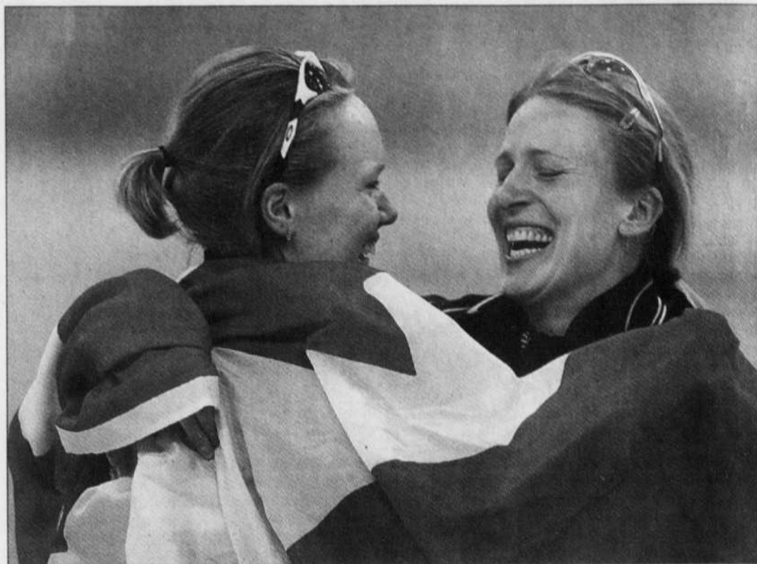
La médaillée d'or Cindy Klassen (à gauche) et la médaillée d'argent Kristina Groves ont fait le tour de l'anneau de vitesse ensemble avec le drapeau canadien après l'épreuve de 1500 mètres, hier.

laissé la pression l'étouffer. «Je suis venue à ces Jeux avec l'intention d'apprécier chaque instant et c'est exactement ce que j'ai fait, a-t-elle précisé. Je pense que c'est ce qui m'a permis d'être détendue lors de mes courses et de bien faire.»