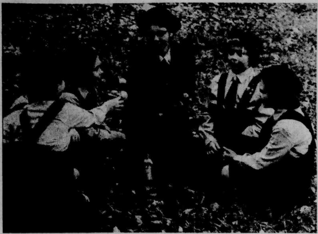
Les vacances saines bien organisées, avec sports et jeux au grand air préparent bien à la vie. Les jeannettes et les guides sont favorisées sur ce point chaque été au Canada. Renseignements: Victor 9-9834.