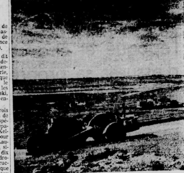
Pour construire ce barrage il faudra déplacer 57 millions de verges cubes de terre. On utilisera près d'un million de verges cubes de béton pour aménager un mur de renforcement d'une épaisseur variant entre 10 à 30 pieds pour empêcher les fuites d'eau. Ce mur sera construit dans le lit de la rivière.

On sait que le président Nasser a affirmé la semaine dernière que cette déclaration n'avait à ses yeux aucune validité depuis les événements de Suez et que la RAU n'en tenait aucun compte.