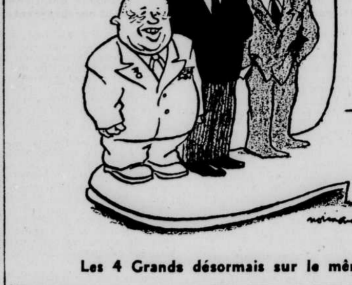
Les 4 Grands désormais sur le même pied (les nouvelles)

Déjà contrariées par les restrictions imposées aux importa-