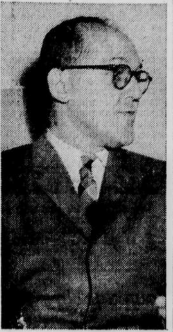
GILLES MARCOTTE, critique littéraire du Devoir, nouveau boursier du Conseil des Arts.

A tout âge, la récréation est nécessaire à la santé mentale et à la santé physique. Les heures de loisirs doivent apporter la détente après la tension du travail ou de l'étude. Le travailleur sédentaire doit choisir des distractions qui conviennent à son âge et à son état de santé; celui qui travaille avec ses muscles devrait choisir des passe-temps plus paisibles.