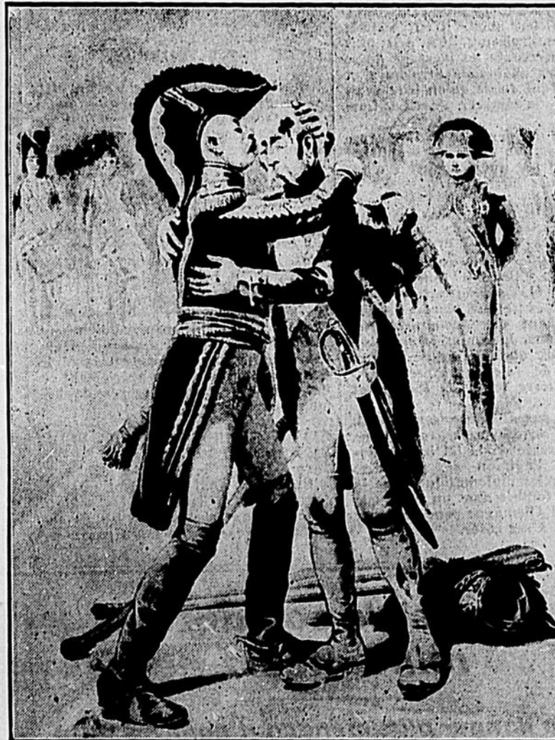
Il embrassa le grenadier, et on vit que les deux hommes pleuraient.

Étérifié, le général s'approcha des troupes ; et lancée au loin, par-dessus les bataillons immobiles, sa voix de charge éclata :