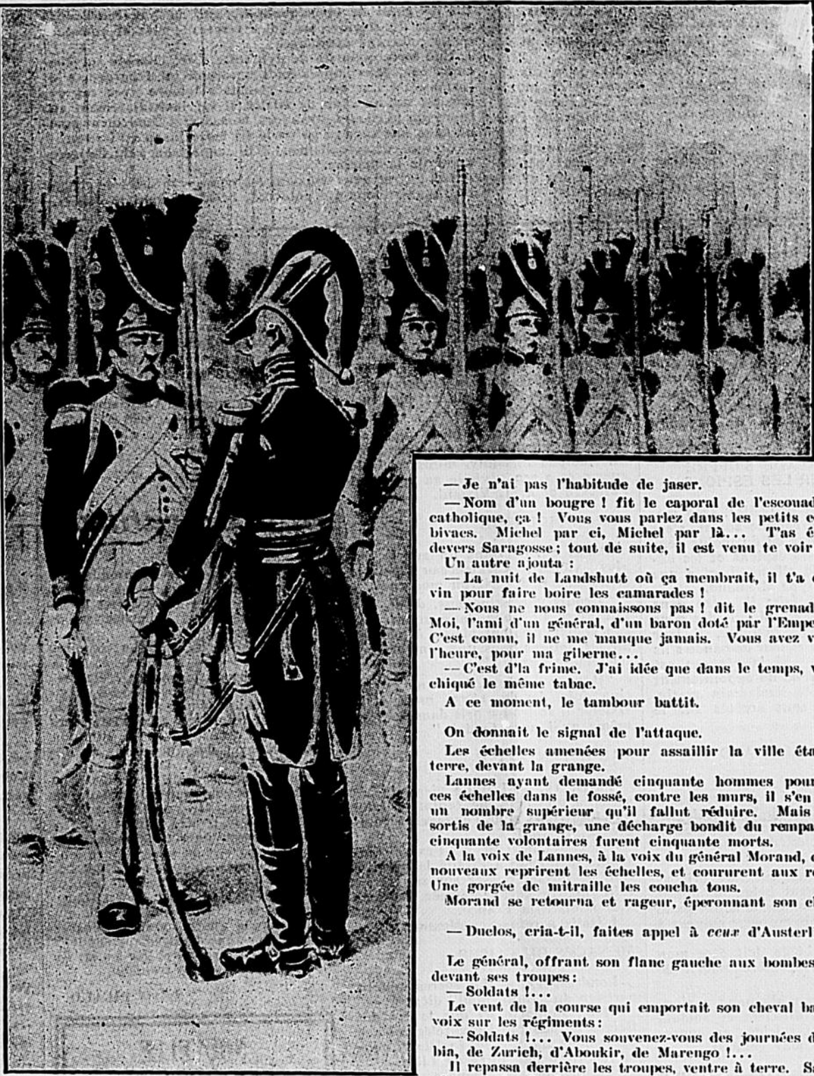
Il passa ainsi la revue du premier rang.

L'homme devint blanc : il ouvrit la bouche pour parler, ses mains tremblèrent... — Allons, dit le général doucement, la tête un peu plus haute... le pouce allongé sur la première capucine... Muet, nerveux, Duclous continua la revue, et un quart d'heure après ordonna la pause. — Michel ! souffla un grenadier. L'homme qui venait d'être réprimandé se retourna. — Quoi ? — Pas possible ! Tu connais le général. On ne nous refait pas ! Même quand il te houscule, vous vous regardez comme des bonn' amies. Le vieux soldat se mit en colère :