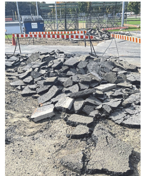
Des morceaux d'asphalte ont été retirés du stationnement de l'aréna de Nicolet vendredi dernier.

Il indique que d'autres endroits à travers la ville subiront du dépavage ultérieurement. « Par exemple, quand nous allons refaire la rue Notre-Dame, nous enlèverons du pavé pour avoir davantage de verdure. On pourrait aussi