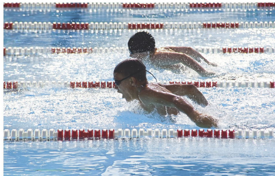
Onze athlètes de Brome-Missisquoi participeront aux épreuves de natation.