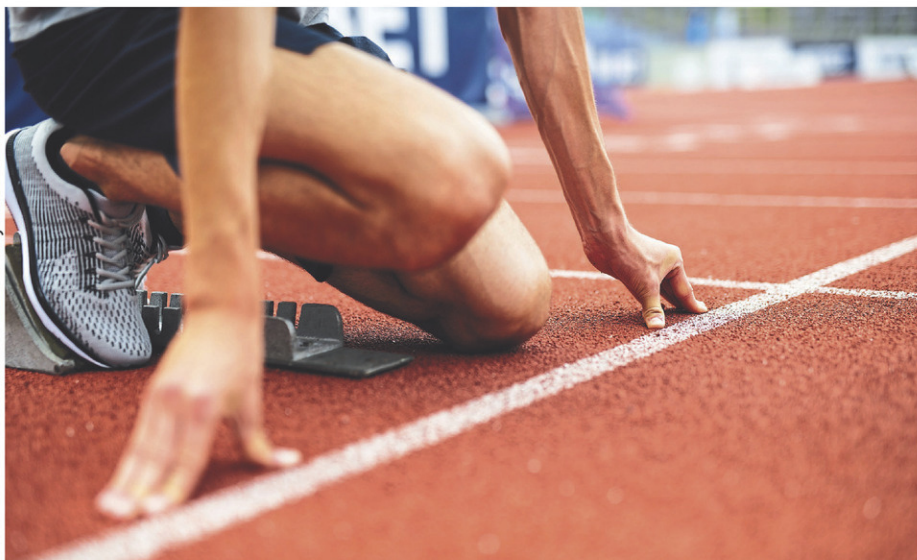
Brome-Missisquoi comptera sur six représentants en athlétisme au sein de la délégation de Richelieu-Yamaska.