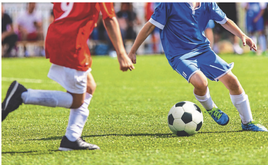
Deux athlètes résidant sur le territoire couvert par L'Avenir et des Rivières seront à Trois-Rivières en soccer.