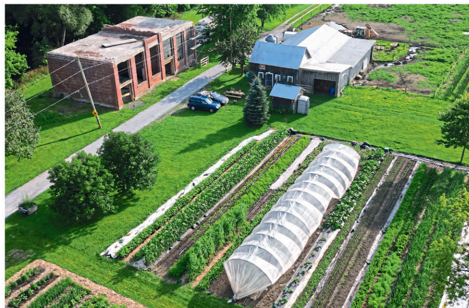
La Ferme de la Tannerie, à Stanbridge East, participe à l'événement Portes ouvertes Mangeons Local 2025, le 7 septembre prochain.

Les sept autres endroits à visiter en Montérégie sont les suivants: la ferme Craven (Clarenceville), la Ferme-école Maskita (Saint-Hyacinthe), la Halte de la montagne (Saint-Damasse), la Petite ferme locale (Notre-Dame-de-l'Île-Perot), les Serres René-Robidoux (Sainte-Christine), le Vignoble Cortellino (Saint-Urbain-Premier), et le Vignoble et Cidrerie Coteau Rougemont.