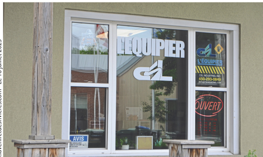
La nouvelle boutique est située sur la rue Saint-Joseph, à Farnham.

Pour la suite, la propriétaire de L'équipier veut garder le modèle actuel au moins une année pour observer les résultats. Sindy Blouin et Cloé Langlois signalent toutefois que la boutique sur la rue Saint-Joseph est temporaire et qu'elles souhaitent déménager à un meilleur endroit.