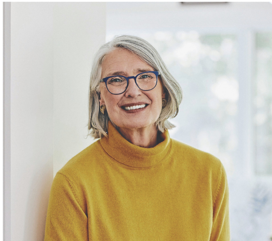
Louise Penny

Cette tournée était planifiée avant l'arrivée en poste du président américain Donald Trump.