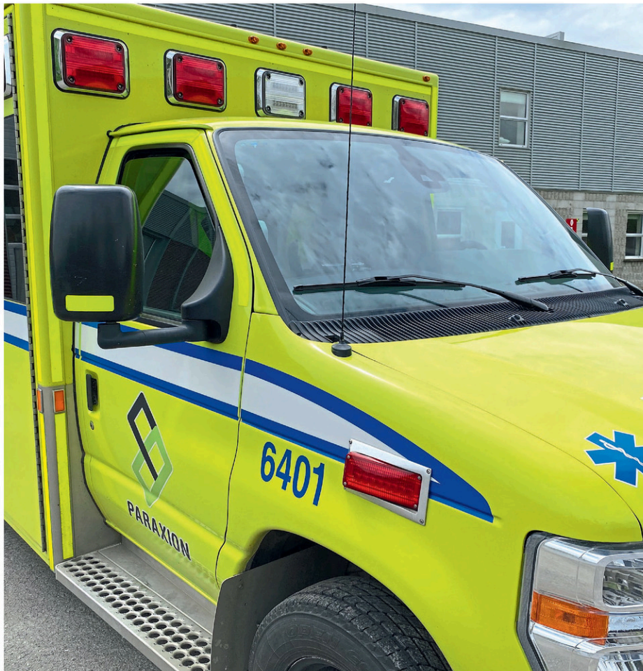
Un accident de travail a entraîné la mort de l'employeur de l'entreprise Dalles & Co, à Farnham.

a été émise, soit l'interdiction de procéder au déchargement des dalles », ajoute-t-elle. Une enquête est toujours en cours.