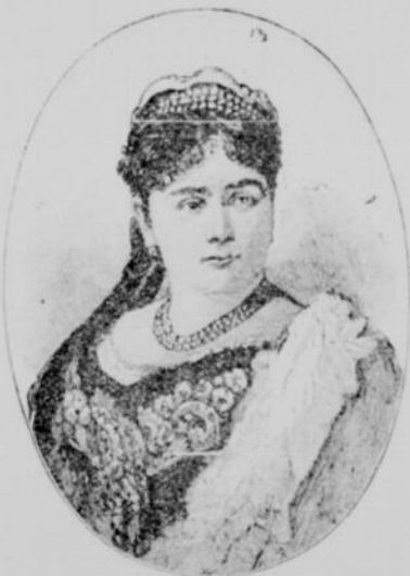
La Princesse Emmeh, veuve de Tewfick Pacha, le Khédive défunt.

Depuis lors, grâce au concours de ses amis anglais, notamment grâce aux conseils éclairés de sir Evelyn Baring, le Khédive rétabli a fait marcher constamment sa patrie dans les voies du progrès.