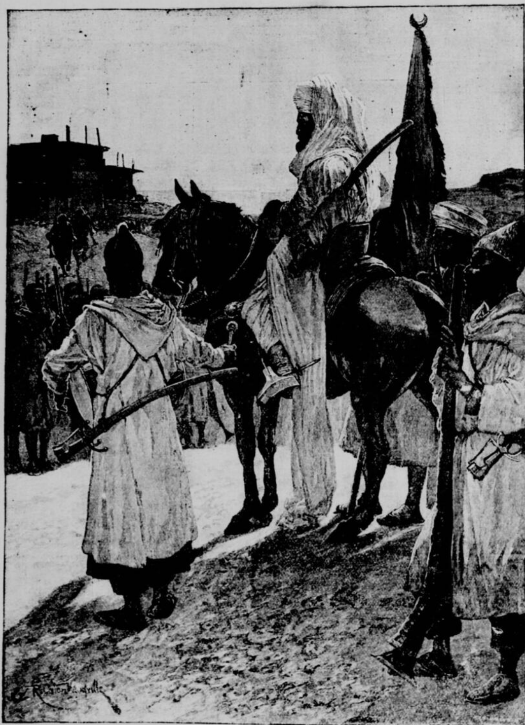
AU MAROC.—Les collecteurs de taxes dans un village des montagnes