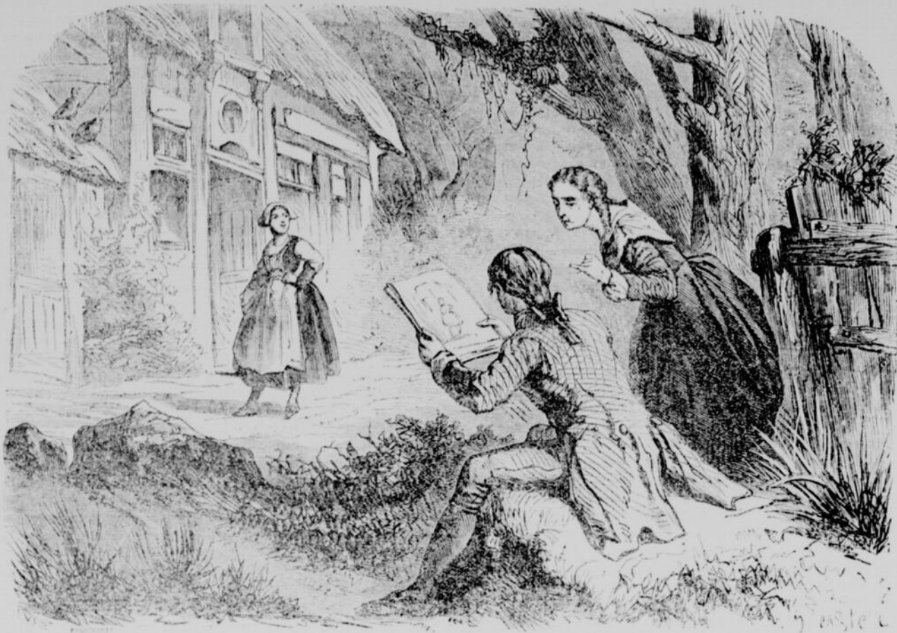
—Ah! monsieur, dit Norah, quel beau dessin!—(page 672, col. 1)