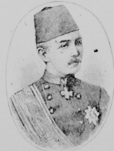
Abbas Pacha, le nouveau Khédive d'Égypte