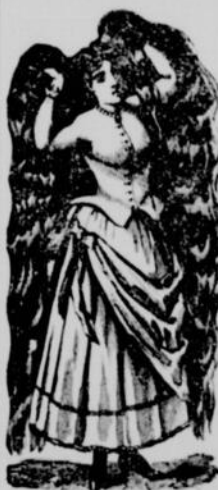
Marque de Commerce.

Cette préparation est hautement re- commandée par des personnes compétentes, plusieurs médecins et autres.