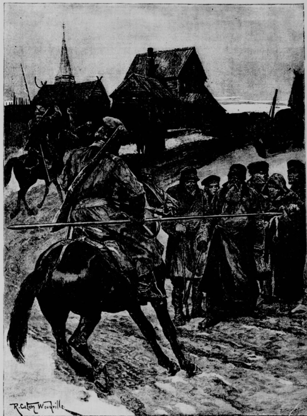
LA FAMINE EN RUSSIE.—Patrouille pour empêcher les paysans de quitter leurs villages