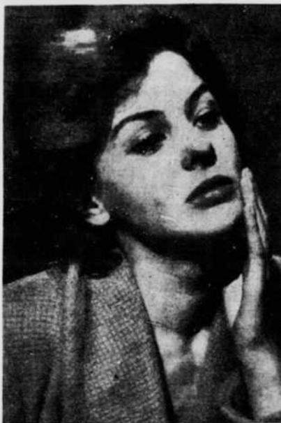
Eléonora ROSSI DRAGO, interprète du rôle de Gianna

A l'instar de tous les auteurs de films italiens, Augusto Genina s'est appliqué à nous donner une peinture fragmentaire de la vie sociale de son pays. Dans Histoires interdites , le cinéaste bien connu raconte l'histoire de trois jeunes filles aux prises avec la solitude, à cette époque de l'anonymat, de l'indifférence et de l'interêt qu'est la nôtre.