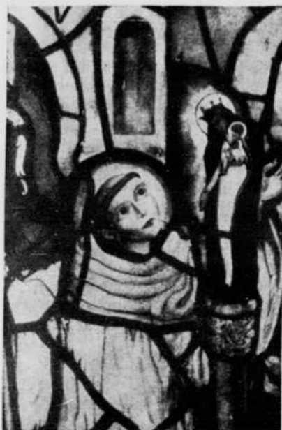
SAINT BERNARD (Vitrail de Jean Huet)

sainte Lutgarde, une sainte cistercienne du XII e siècle. L'auteur ne se perd pas ici dans une recherche historique, dans une critique des textes, mais il vit en communion étroite avec l'immense effort de sainteté de notre Eglise.