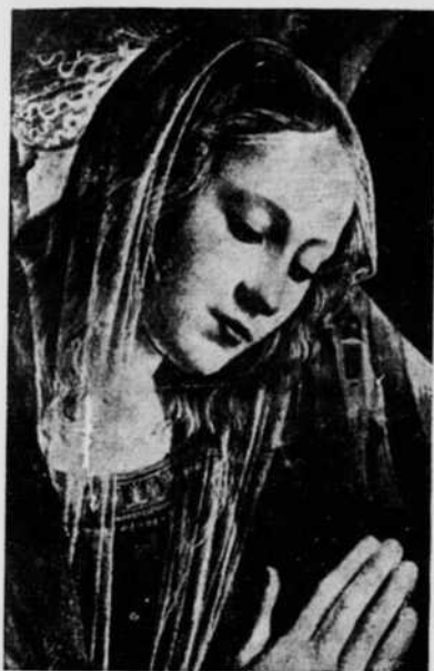
TÊTE DE LA VIERGE par D. Ghirlandajo

Ce livre se divise en trois parties principales.