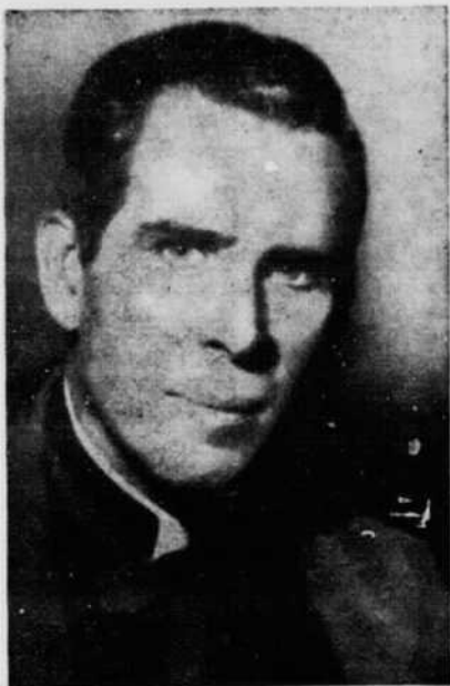
Mgr Fulton J. SHEEN

Cette « synthèse de l'idéal chrétien, vu et présenté par un prélat américain qui connaît son temps et parle la langue de son temps » n'est pas dans le ton habituel des écrits de Mgr Sheen : il est beaucoup plus philosophique que les autres. L'auteur y traite longuement de l'existence en chacun de deux personnalités qui se combattent, s'entraident et se neutralisent tour à tour : le « je » et