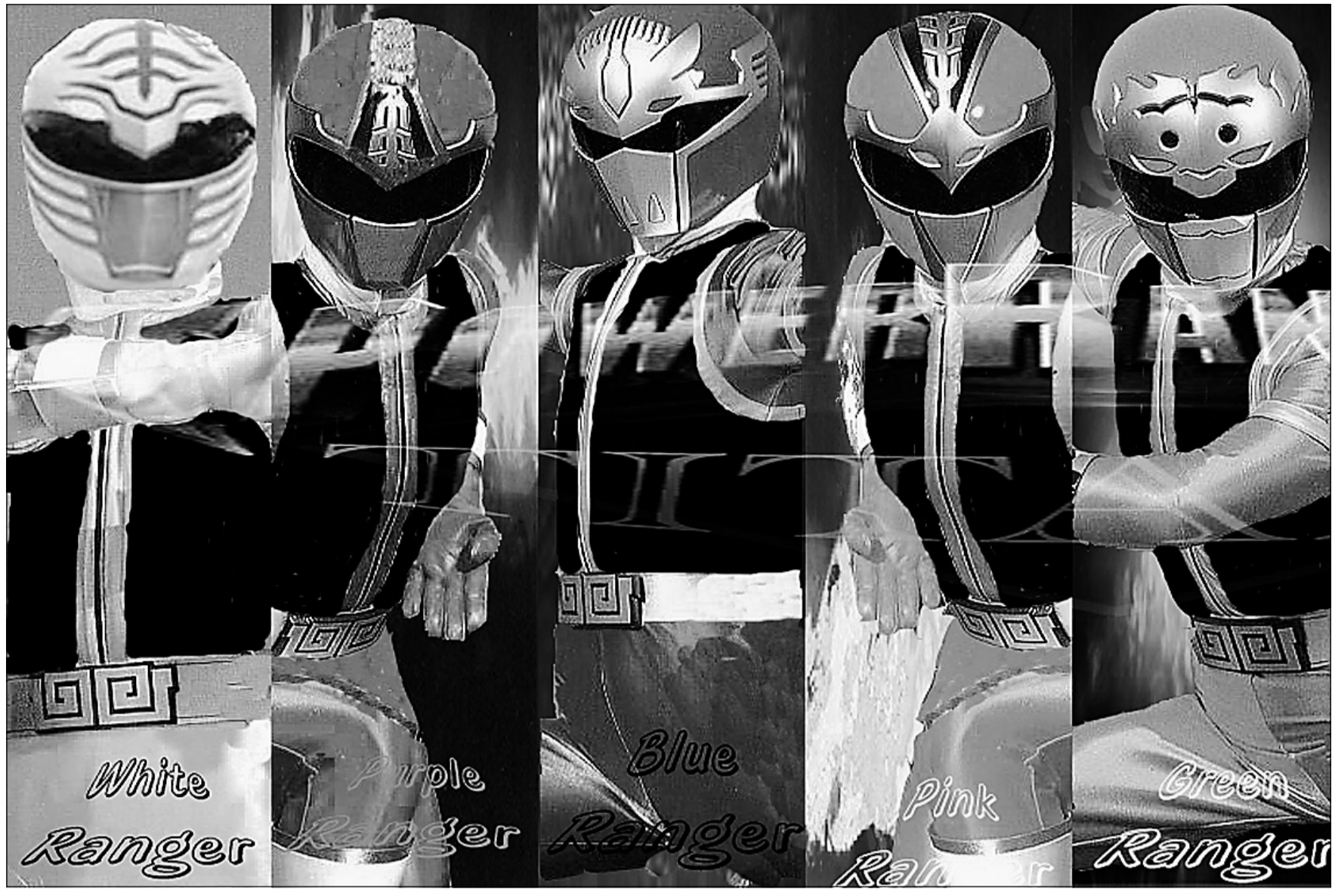
Bandai a lancé une collection unique de figurines Mighty Morphin Power Rangers.

Des mots d'enfants? Des suggestions? Écrivez-nous à : La Presse, a/s section Famille, 7, rue Saint-Jacques, Montréal, H2Y 1K9 actuel@lapresse.ca