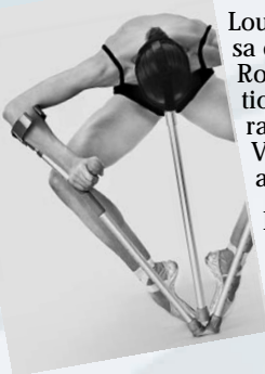
BODY_rEMIX/gOLDBERG_vARIATIONS au Teatro Piccolo Arsenale

La Compagnie Marie Chouinard était également présente à la Biennale de Venise pour la présentation de