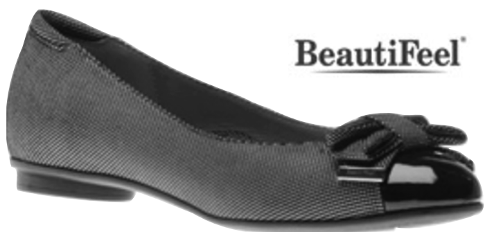
Ballerine en cuir meshé noir et blanc

(disponibles à notre boutique de Saint-Lambert seulement)