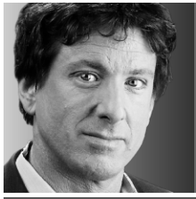
YVES BOISVERT CHRONIQUE

Une grève étudiante... des milliers de jeunes dans la rue... C'était comme un petit bout de 2012 qui nous revenait hier à Montréal.