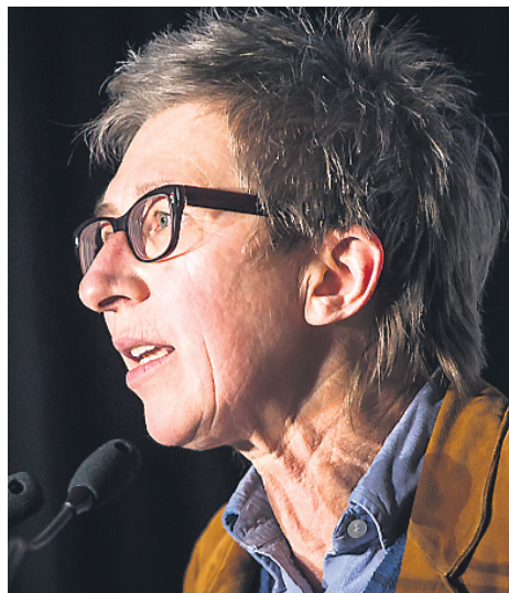
Aucune autre autorité en Amérique du Nord n'aurait toléré pareille calomnie.

En outre, la certification cachère ne comprend ni bénédictions, ni prières, ni transformation des aliments. Ce système de supervision n'est d'ailleurs pas exclusif à la nourriture cachère. Des organisations similaires certifient des produits sans gluten, des produits biologiques