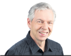
BERNARD BRAULT PHOTOJOURNALISTE