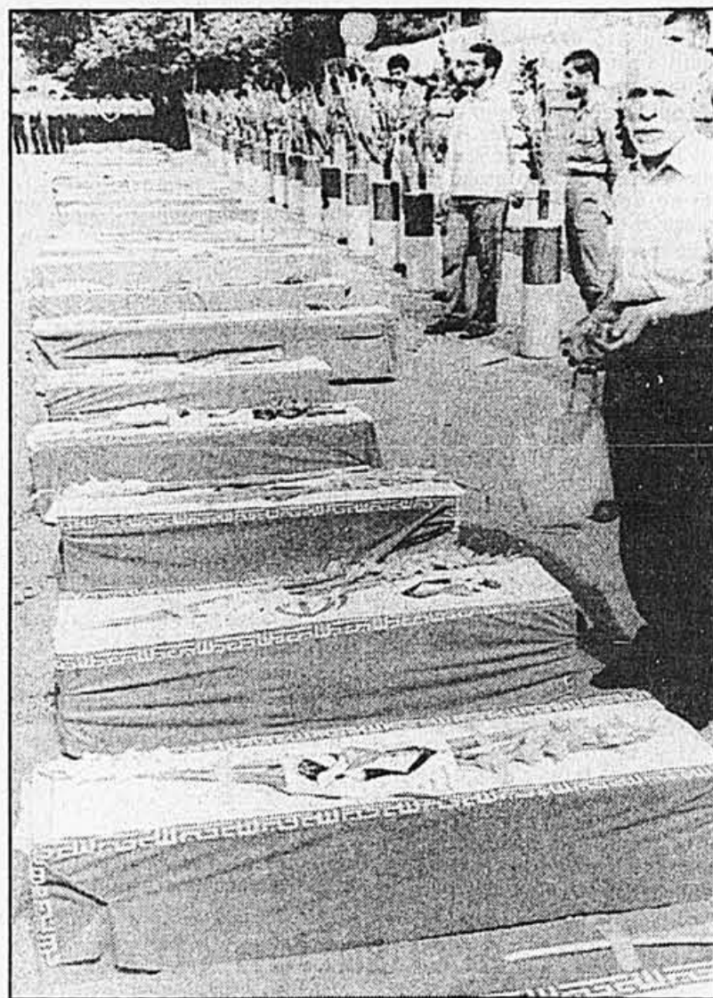
Des l'arrivée devant le parlement des cercueils de certaines des victimes de la tragédie de l'Airbus 300, l'Iran réclamait réparation.

Enfin, affirme le Sunday Times , selon un rapport préparé par les services secrets britanniques, la marine américaine est «sévèrement critiquée» pour son action contre l'Airbus. Selon ce rapport, l'Airbus se trouvait dans le «bon couloir aérien» et que les combats qui ont opposé le croiseur Vincennes à des vedettes iraniennes, avant que l'Airbus ne soit abattu, «pourraient avoir été provoqués par des hélicoptères américains qui se trouvaient dans l'espace iranien». «Les règles d'engagement de la marine américaine ont été rédigées de telle façon qu'elles devaient conduire à un désastre», estiment les sources du ministère de la Défense britannique.