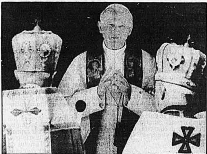
Le pape Jean-Paul II prie en face de deux évêques ukrainiens lors d'une cérémonie religieuse de rite byzantin à l'église Sainte-Sophie de Rome.

Mgr Frantisek Rypar, chef du Bureau des séminaires de la congrégation pour l'enseignement catholique;