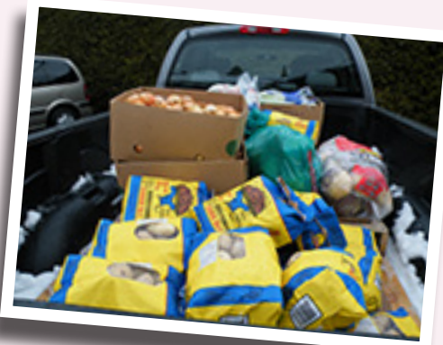
Exemple de denrées offertes aux familles.