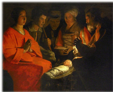
L'adoration des bergers, Georges de la Tour, 1645