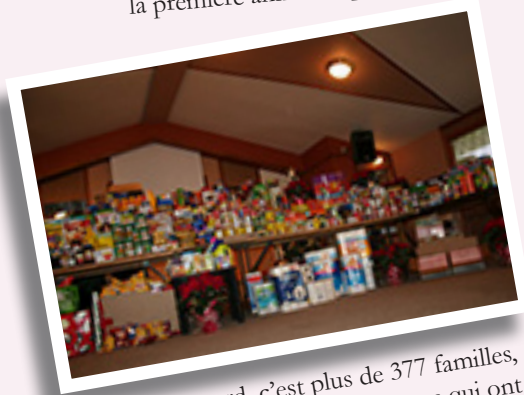
15 ans plus tard, c'est plus de 377 familles, pour un total de 981 personnes qui ont bénéficié de La Boîte à sourires .