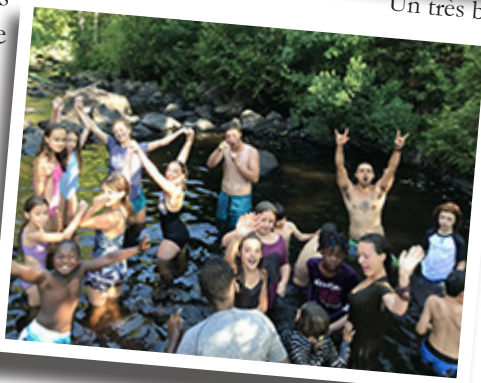
Des baigneurs heureux..