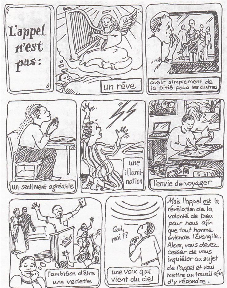
Jean Isch, Jusqu'au bout du monde , Éditions Soula Isch/SIM Canada, 2000, p. 28.

La mise en oeuvre de cette grande Commission passe par la proximité, le respect et beaucoup de confiance entre individus. Cela s'exprime par des petits moments de qualité avec nos voisins, des sourires chez l'épicière, des peines partagées avec une sœur éprouvée et des mains tendues à l'étranger.