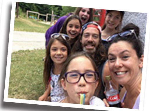
Une belle gang..