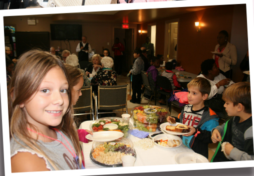
Le tout s'est terminé par un bon repas dans la joie et la gratitude. ☐