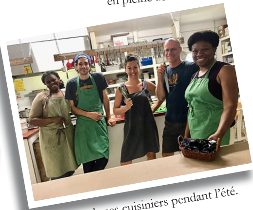
Quelques cuisiniers pendant l'été.