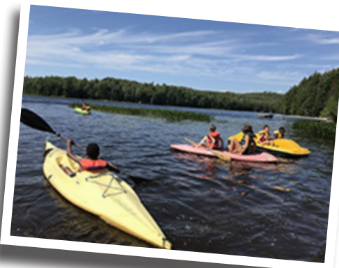
Un très beau lac..