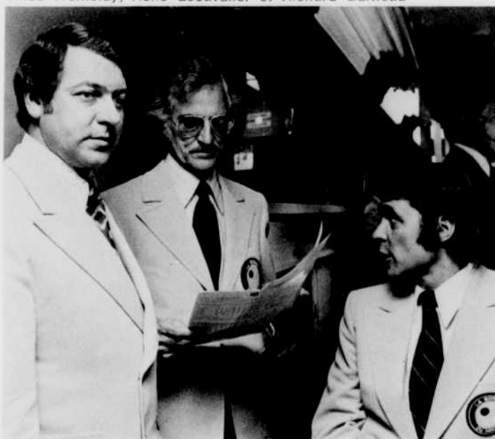
Gilles Tremblay, René Lecavalier et Richard Garneau