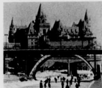
Les Provinces de l'Atlantique