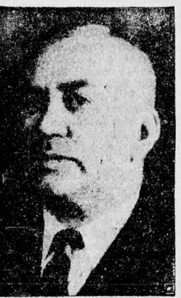
Le général L.R. LAFLECHE dont la nomination comme ministre canadien en Grèce, est confirmée officiellement.