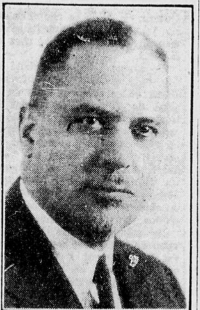
Le Dr. RAOUL HURTUBISE, ancien député fédéral de Nipissing qui a été nommé sénateur.