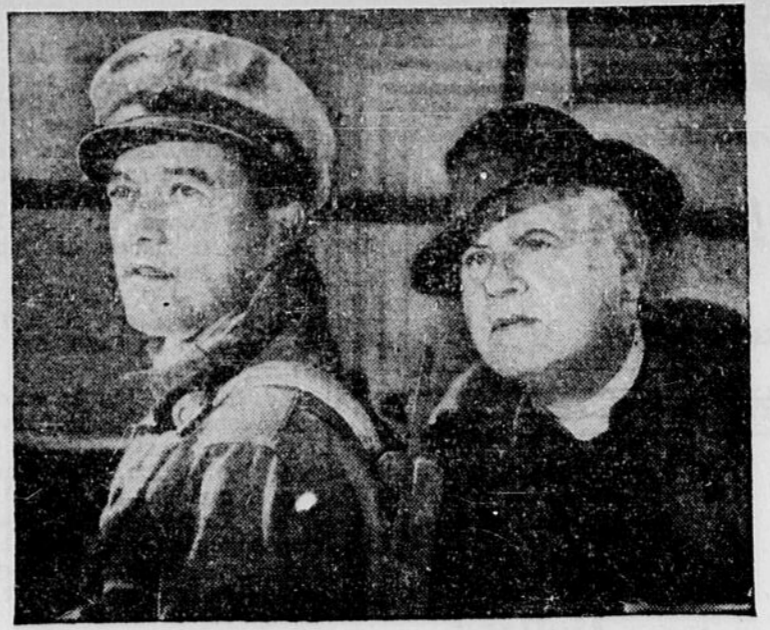
Col. Scott (Dennis Morgan) et "Big Mike" (Alan Hale), un prêtre missionnaire, dans une scène captivante du film "GOD IS MY CO-PILOT" de Warner Bros., à l'affiche au Centre. La distribution comprend aussi Raymond Massey, Andrea King, Dane Clark et John Ridgely. Au Centre actuellement.