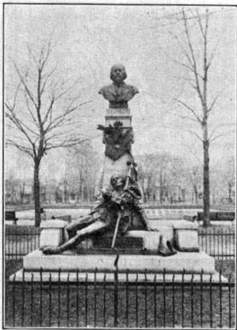
LE BUSTE D'OCTAVE CREMAZIE Square Saint-Louis, à Montréal

Les vacances ne vous ont pas enlevé, je le vois, l'intérêt que vous portez aux grands hommes et aux faits historiques de chez nous. A la bonne heure. Reconnaissez avec moi que des vacances sagement prises ne donnent que plus de courage et de goût pour se remettre à l'étude.