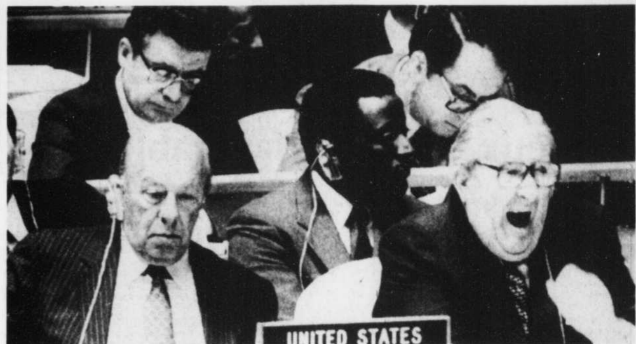
L'ambassadeur des États-Unis aux Nations-Unies, Vernon Walters, baille sans retenue durant le discours du président du Brésil, José Sarney. A la gauche de M. Walters, le secrétaire d'État américain, George Shultz.

Il n'a pas fait allusion à l'offre de moratoire soviétique sur les tests nucléaires, mais a souligné que les États-Unis sont également intéressés par des limites vérifiables sur ces tests. M. Shultz a aussi indiqué que les États-Unis allaient présenter une proposition d'interdiction des armes chimiques devant l'ONU.