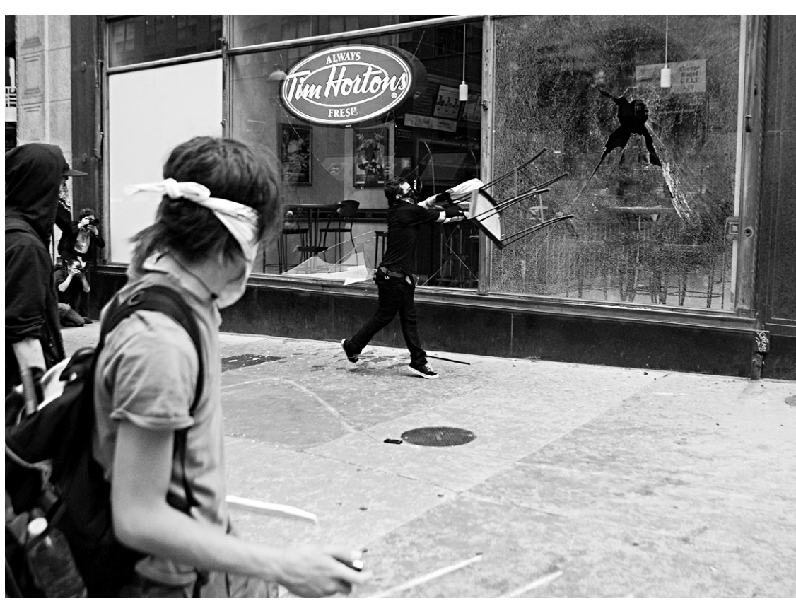
Les cibles du Black Bloc ne sont pas choisies au hasard.

Les militants cherchent à attirer l'attention. «Ce qui prime, c'est l'action, les Black Blocs se greffent aux manifestations car ce sont des opportunités d'agir», indique Isabelle Sommier. Francis Dupuis-Déri soutient que la visibilité des casseurs est plus forte que s'ils tenaient