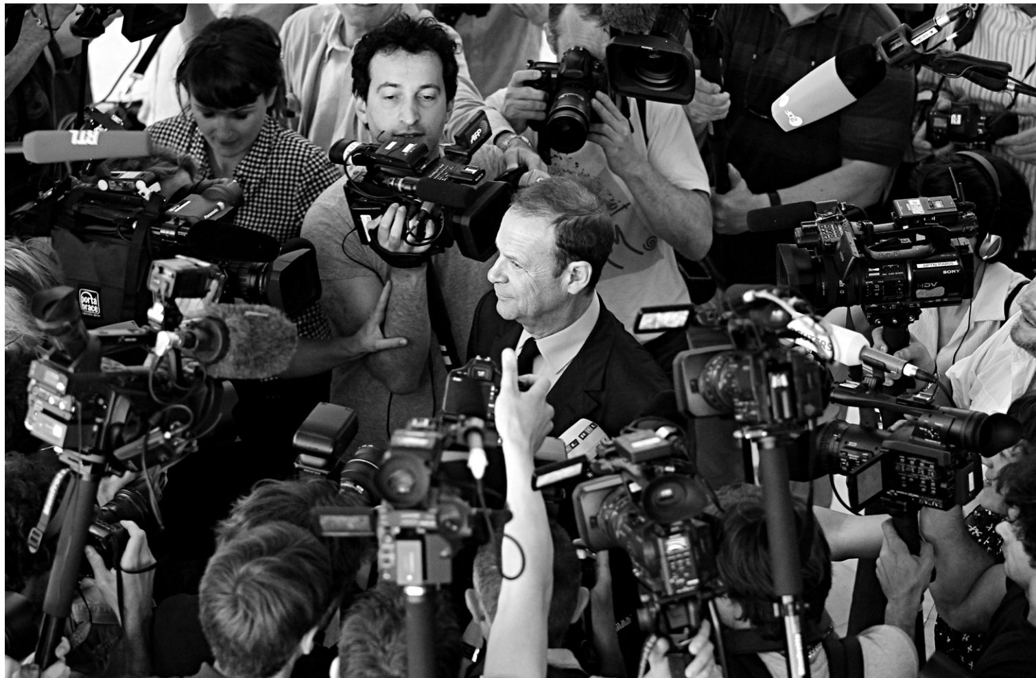
Le photographe François-Marie Banier jeudi, après sa comparution en cour à Nanterre.