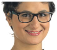
CHRISTELLE TANELIAN TEXTE ET PHOTO COLLABORATION SPÉCIALE

Dans la catégorie des boissons chaudes et réconfortantes, je demande le latte d'or (ou « lait d'or », mais l'italien, je trouve que ça sonne bien).