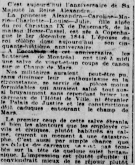
SA MAJESTE LA REINE ALEXANDRA

Le total des droits de douane perçus sur les importations durant le mois de novembre 1902 est de 1,050,451.50. Novembre 1901 était de 758,679.12. Soit une augmentation de $291,772.38.