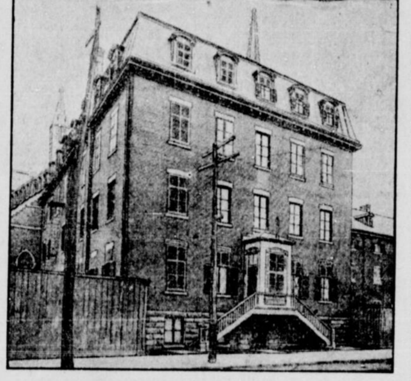
AU JARDIN DE L'ENFANCE

Les petits écoliers du Jardin de l'Enfance se sont vu refuser ce matin la porte de leur classe.