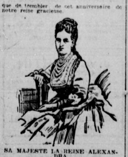
SA MAJESTE LA REINE ALEXANDRA

La vente du pain Les boulangers, non encore résolus à accepter le nouveau règlement de police interdisant la vente des pains aux-trois que ceux pesant une, deux et quatre livres, fait circuler des requêtes parmi le public afin de recueillir un nombre suffisant de signatures pour convaincre le Conseil de Ville de l'opportunité de vendre à l'avenir le pain à "7c" plutôt qu'à pain.