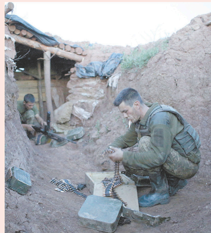
Libéraux et conservateurs se rangent sans conteste derrière l'Ukraine et la défense de son intégrité territoriale.

Pour ce qui est du reste, on peut parler d'un sujet quasi accidentel en dehors