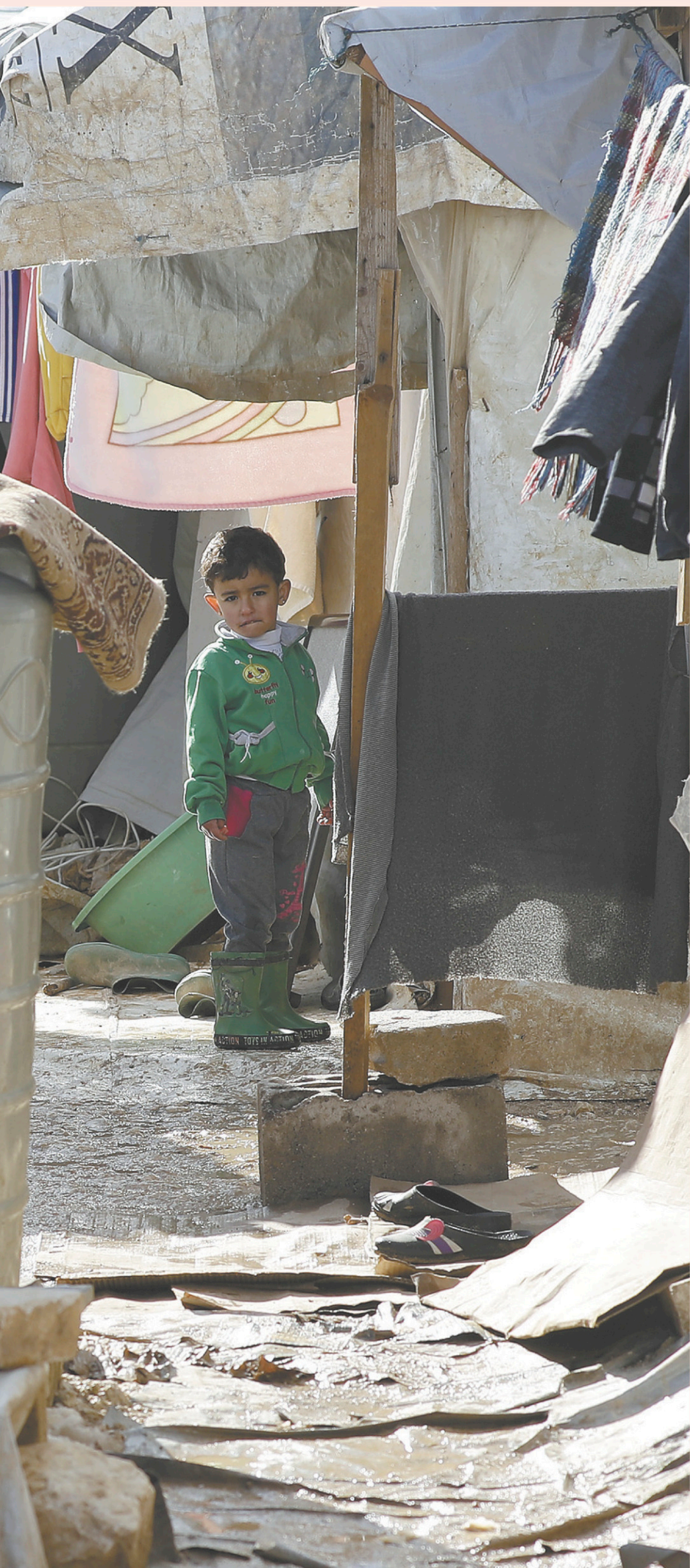
Quand on regarde la liste des pays au-dessus du seuil de 0,6 et qui reçoivent du financement, on va trouver plusieurs pays qui soutiennent des populations déplacées, comme par exemple le Liban qui accueille de réfugiés syriens.