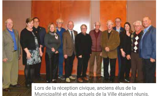
Lors de la réception civique, anciens élus de la Municipalité et élus actuels de la Ville étaient réunis.

Ce caractère et cette position se sont aussi reflétés sur le plan administratif. Le statut de ville vient en effet clarifier les devoirs légaux de certaines fonctions qui existaient déjà au sein de l'administration, par exemple le greffier et le directeur des finances. Pour les municipalités régies par le Code municipal, le seul officier imposé par la loi est le secrétaire-trésorier. Dans une ville, 3 officiers municipaux sont imposés par la Loi des cités et villes , soit le greffier pour les affaires légales et juridiques et le trésorier pour les affaires financières, tous deux assurant la mission, avec le directeur général, de soutenir le conseil et l'administration municipale dans ses décisions.