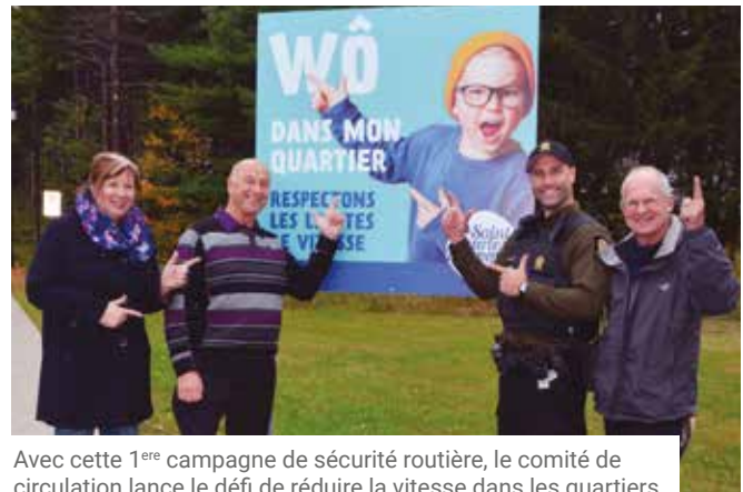
Avec cette 1 ère campagne de sécurité routière, le comité de circulation lance le défi de réduire la vitesse dans les quartiers.

Le comité de circulation table donc sur le renforcement positif des comportements sécuritaires par la promotion de messages incitatifs. La Ville estime qu'il s'agit d'une perspective à consolider au cours des prochaines années.