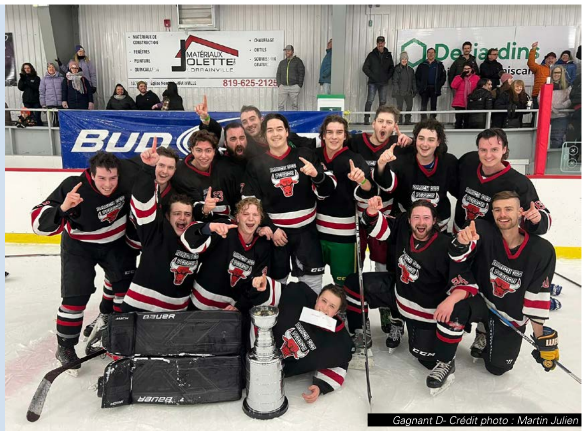
Gagnant D-