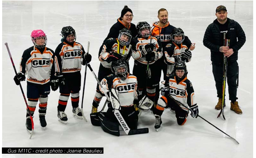
Gus M11C - credit photo : Joanie Beaulieu

Le M13 C Pièces d'auto Brousseau s'est rendu à Macamic pour affronter le L.J.L Mécanique de La Sarre. C'est de toujours jouer de son mieux. Il profite de toutes les occasions pour passer la rondelle à ses coéquipiers tout en réalisant de nombreuses échappées au cours des matchs. Katy, la joueuse numéro 7, a travaillé très dur pour améliorer ses compétences en tant que joueuse défensive de l'équipe. Sur la glace et à l'extérieur, Katy maintient toujours l'esprit d'équipe en vie. Le prochain match de Pièces d'Auto Brousseau